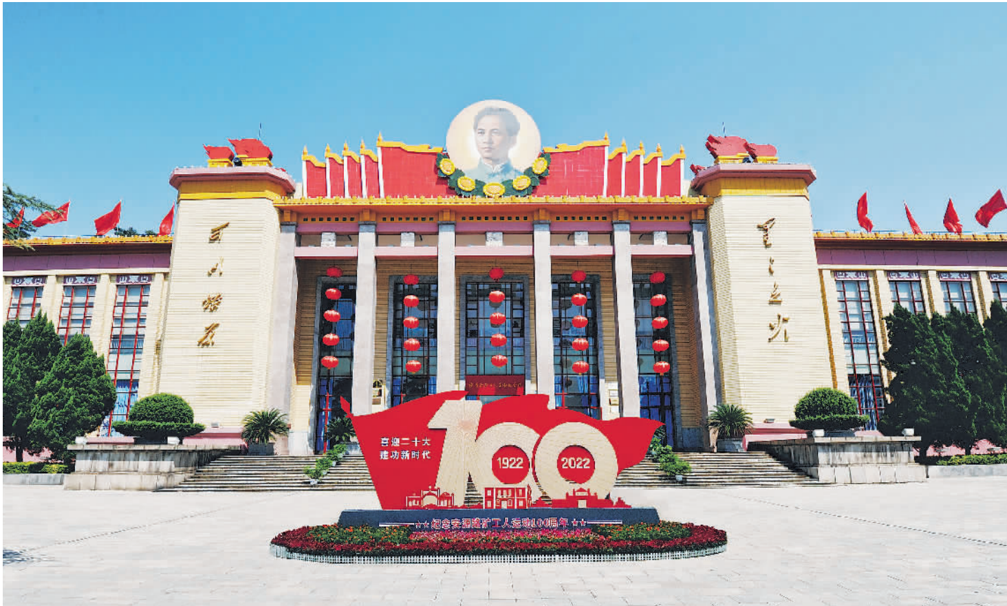
安源路矿工人运动纪念馆。

哪里有剥削、有压迫，哪里就有反抗、有斗争。1901年至1919年，安源工人进行了多次反抗斗争。1905年安源工人为反对监工克扣工资举行罢工；1906年安源工人为反对矿局将窿内三班制改为两班制和解雇工人，举行了罢工；1919年1月安源工人掀起了驱逐德国监工的斗争，将在安源盘踞了21年的德国监工全部驱逐出境。