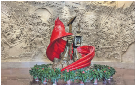
安源路矿工人运动纪念馆序厅中间的主雕塑。

安源是党领导的中国工人运动的摇篮，是秋收起义的策源地和主要爆发地。100年前，老一辈无产阶级革命家为践行党的初心和使命，相继来到安源开辟和领导工人革命斗争，唤起工农千百万，领导闻名全国的安源路矿工人大罢工，这是中国共产党第一次独立领导并取得完全胜利的工人斗争。