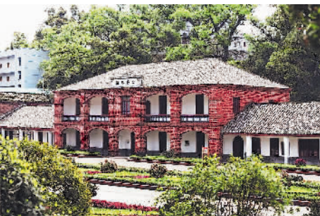
安源路矿工人大罢工谈判处旧址。

安源路矿工人俱乐部在罢工胜利后，出色地实现了工团的产业联合和地区联合，进而有力地推动了工团的全国大联合。同时，安源党员发展到20余人，团员发展到90人，并相继成立了党、团组织的安源地方委员会，俱乐部部员发展到1.2万多人，党、团、俱乐部组织也得到了进一步的发展壮大。安源路矿工人大罢工在“未伤一人，未败一事”的前提下取得完全胜利，既扩大了党的政治影响，巩固了党的阶级基础，也锻炼了工人的斗争能力，激励了全国其他地区的罢工斗争。