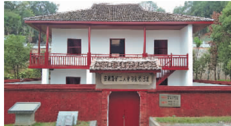
安源路矿工人补习夜校旧址。

在党的一大召开后，以毛泽东、刘少奇、李立三等共产党人为代表的老一辈无产阶级革命家带着中国共产党人的初心和使命来到安源开展工人运动。1921年秋，毛泽东到安源实地考察工人情况，决定把安源作为发展工人运动的重点区域。随后，毛泽东与