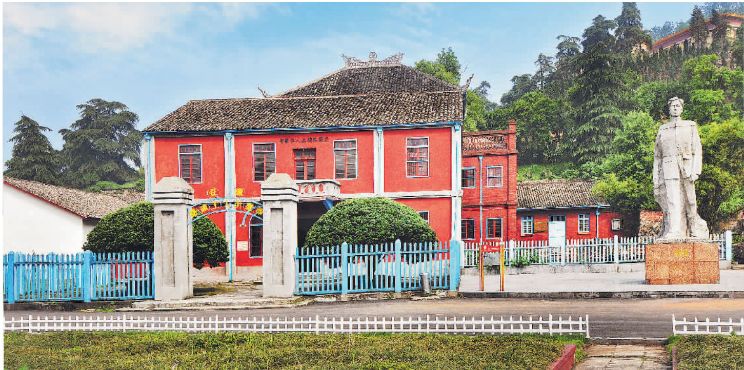
安源路矿工人俱乐部旧址。

在煤矿总平巷井口的复原陈列的两侧，塑有矿工在井下劳动泥塑群。当时在煤矿工作的工人大多数是来自于湖南、湖北和江西等省的破产农民，路矿两局工人的人数可达1.3万多人。工人们在黑暗潮湿的井下干活，身上只围一块三尺长的布，这块布有几种用途，包头、围身、洗澡等；他们每天劳动12小时以上，渴了没有水喝，累了也得不到休息，工作环境十分恶劣；有的巷道非常矮小，工人只能侧躺着挖煤，挖出来的煤全靠人拖运。据1918年时的统计，工人中患矽肺、肠胃病等的比例达90%以上。