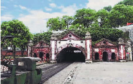
安源煤矿井口——总平巷。

炭运输的总巷道，是用红砖砌成的牌坊式建筑，巷口上方塑有铁锤岩尖图案和“总平巷”三个醒目大字，岩尖代表采煤工人，铁锤代表机械工人。