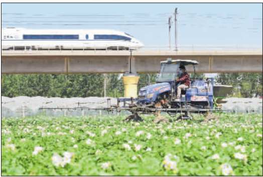
5月21日,在河北省新乐市小流村,农民驾驶农机对马铃薯进行管护。