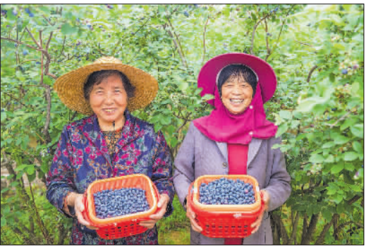
5月18日,浙江省长兴县林城绿健蓝莓专业合作社,采摘蓝莓的果农。