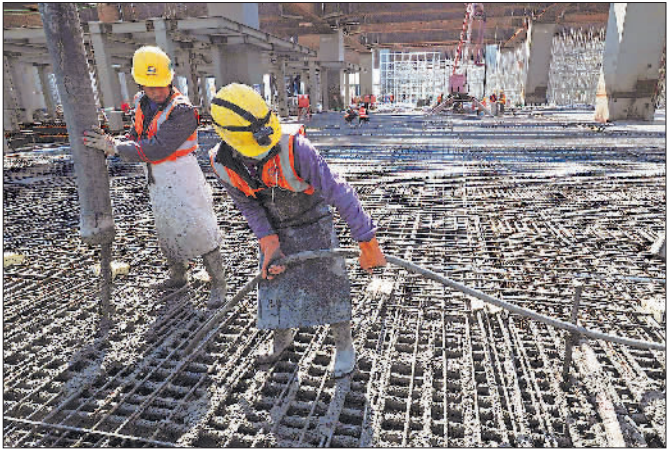
2020年4月13日,施工人员在二楼高架候车室的施工中浇筑混凝土。