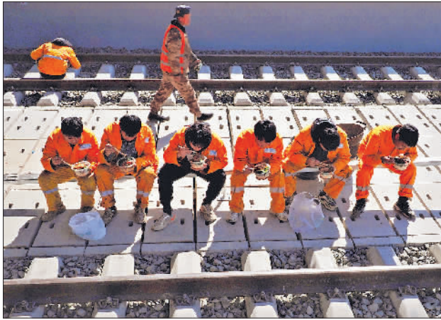
2022年2月24日,为了节约时间,建设者便在施工现场吃午饭。