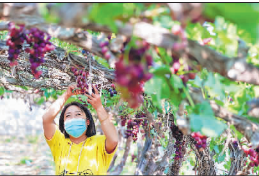
5月26日,游客在河北省唐山市丰南区王兰庄镇一家庭农场采摘葡萄。