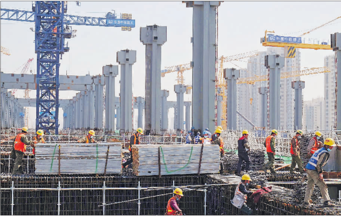
2020年4月14日,处于紧张施工中的北京丰台站。