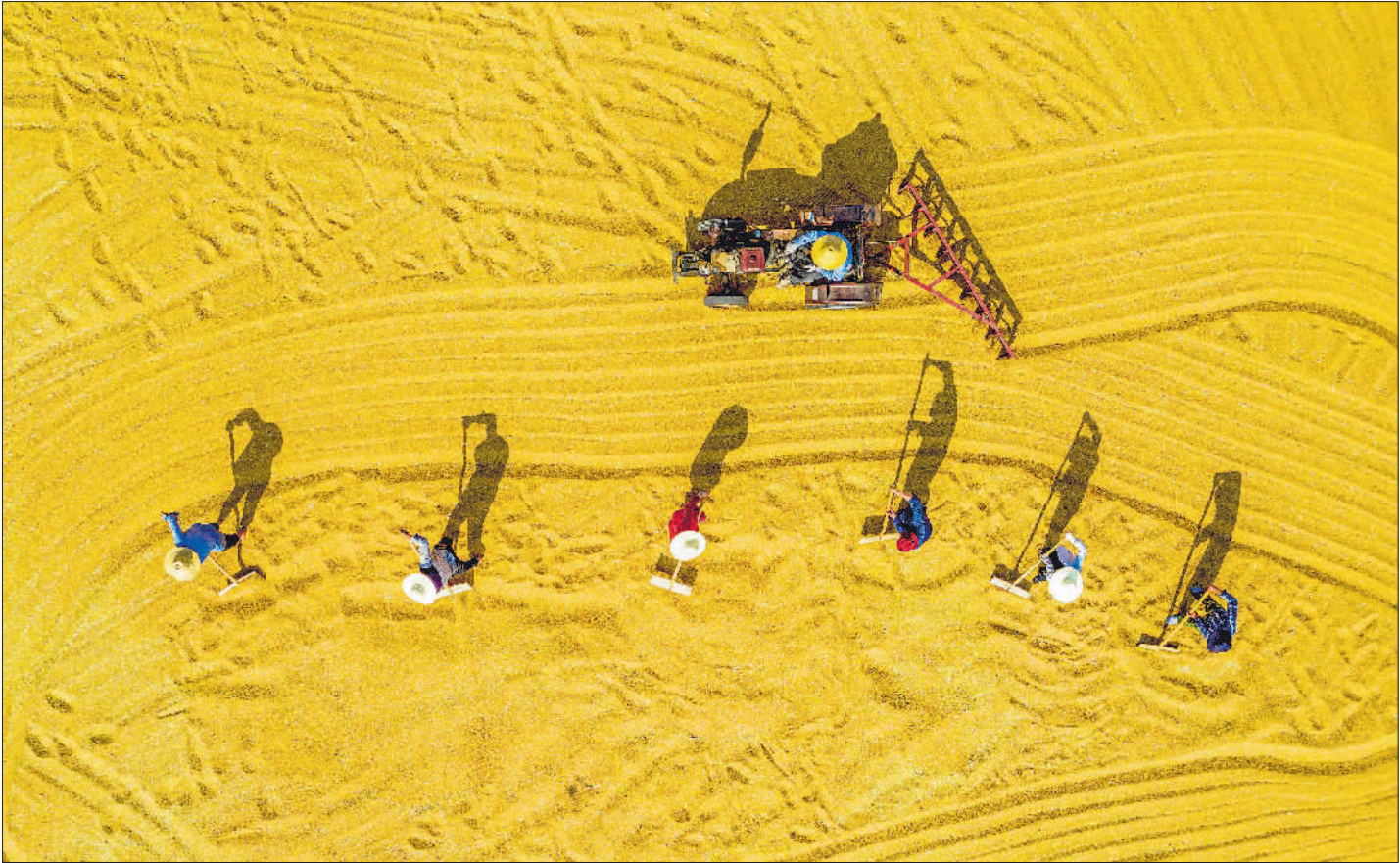
5月24日,在安徽省庐江县白湖镇省级现代农业示范基地,农民在谷场上翻晒小麦。