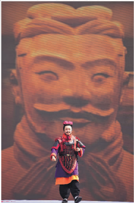
陕西主会场活动上,演员表演复原秦汉展示《秦汉开疆 四海归一》。