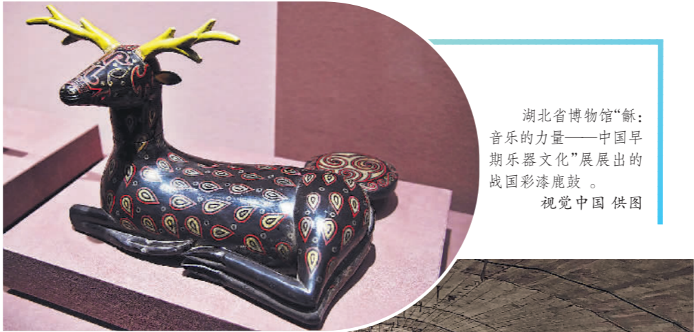
湖北省博物馆“ 甌 :音乐的力量——中国早期乐器文化”展展出的战国彩漆鹿彫。

武昌首义中学七年级3班学生林光熙在情景剧里饰演一位冲锋陷阵的辛亥勇士,在“冲锋”的情景中,一遍遍地向“总督府”发起进攻,“通过情景剧的演绎,我设身处地地感受到了起义时的艰难险阻,也更加珍惜今天