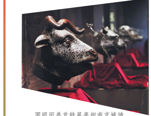
圆明园兽首特展亮相南京城墙博物馆。