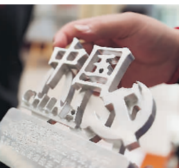
↑5月10日,安徽省滁州市应用技术学校2022年职业教育活动周上展出的学生车工作品。