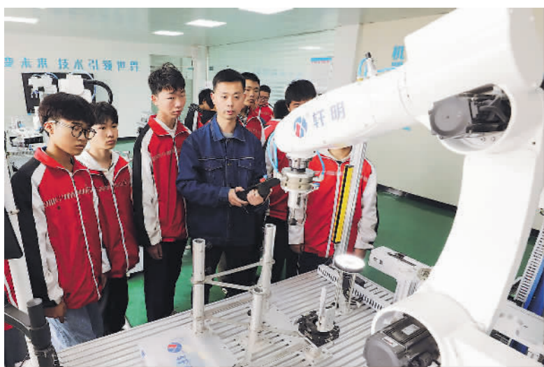
5月12日,河南省焦作市温县职教中心机械加工专业教师在指导学生进行工业机器人实操训练。