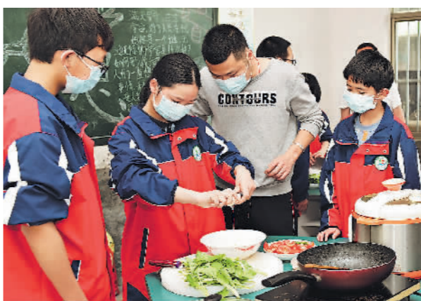
5月11日,湖南省邵阳市洞口县花园镇西中九年一贯制学校,七年级二班学生在劳动实践课上学习炒菜、煮饭。 滕治中 米赛男摄

4月21日,教育部发布的《义务教育课程方案和课程标准(2022年版)》,增设了义务教育劳动课程标准。