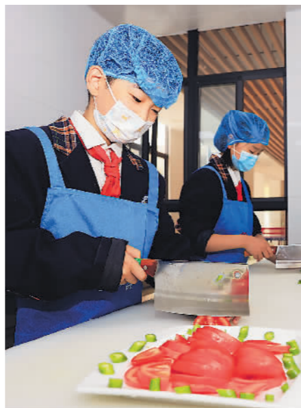
→5月9日,在安徽省合肥市庐阳区林店街道安庆路第三小学灵溪校区食堂,小学生正在体验切西红柿。