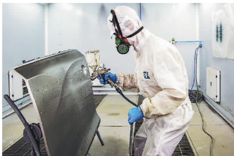
5月12日,在位于山东省淄博市淄川区的山东水利技师学院,学生正在参加新能源汽车技术技能竞赛。