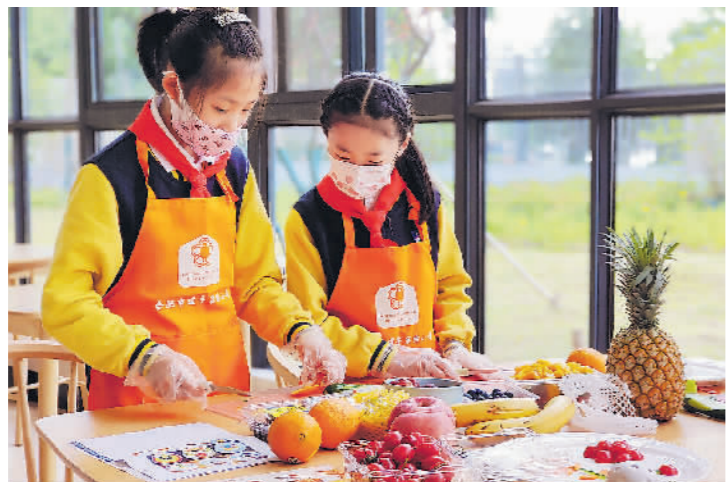
→5月12日,安徽省合肥市建平实验小学南艳分校的一节劳动实践课上,学生们正在制作创意水果拼盘。