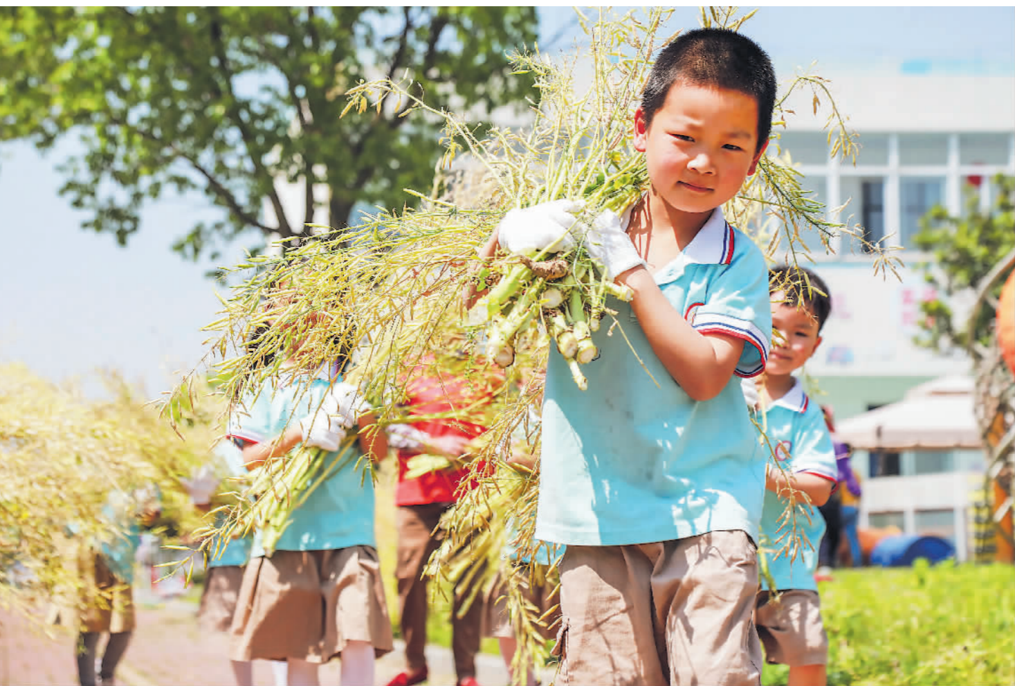
↑5月11日,在浙江省湖州市长兴县太湖街道中心幼儿园校园农场开展的“我劳动,我快乐”学农活动上,孩子们正在体验收获油菜。

消息一出,引起社会的大量关注和热议。各地学校纷纷积极响应,推出各种形式的劳动课。以下是《工人日报》通讯员来稿选登。