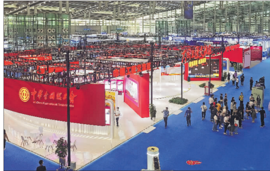
↓4月28日,广东深圳,市民正在首届大国工匠创新交流大会展区参观。