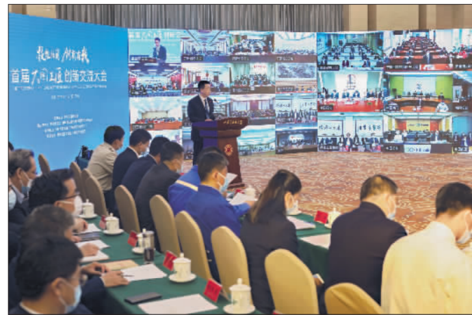
←4月27日,首届大国工匠创新交流大会开幕。开幕式以视频方式举行,设置了北京主会场及81个分会场。