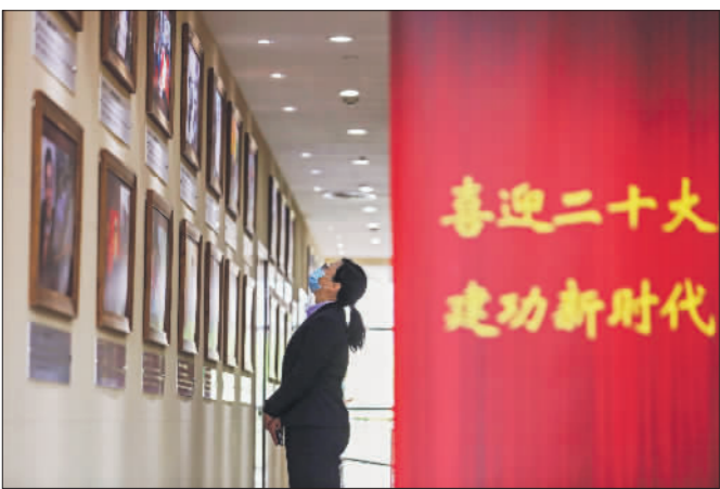
4月28日,中国职工之家,一名工作人员在观看会场外的劳模图片展。