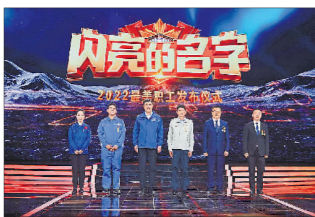
→4月22日,北京,在2022年“最美职工”发布仪式上,入选者上台领奖。