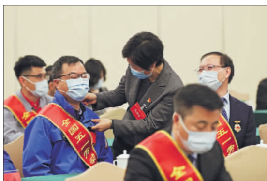
4月28日,庆祝大会开始前,工作人员为一位获奖代表整理工装。