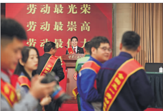
4月28日,庆祝大会结束后,代表纷纷上台拍照留影。