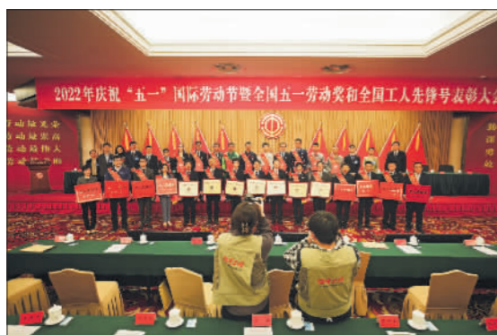
4月28日,庆祝大会结束后,获奖代表和工作人员一起合影。