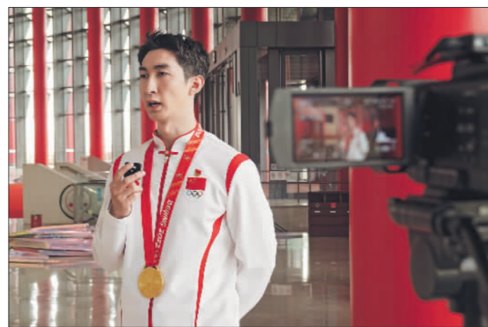
←4月21日,北京雁栖湖国际会议中心,2022年“中国梦·劳动美”——庆祝“五一”国际劳动节心连心特别节目后台,中国短道速滑运动员武大靖接受《工人日报》记者采访。