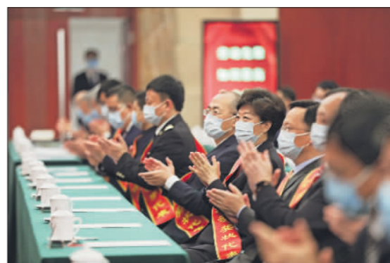
4月28日,庆祝大会现场。

从2022年庆祝“五一”国际劳动节大会现场到首届大国工匠创新交流大会展区;从“五一”国际劳动节特别节目录制到“最美职工”发布;从线下交流到“云”端互动……2022年庆祝“五一”国际劳动节系列活动精彩纷呈。劳动者在这个属于自己的节日里收获祝福,感受荣光。