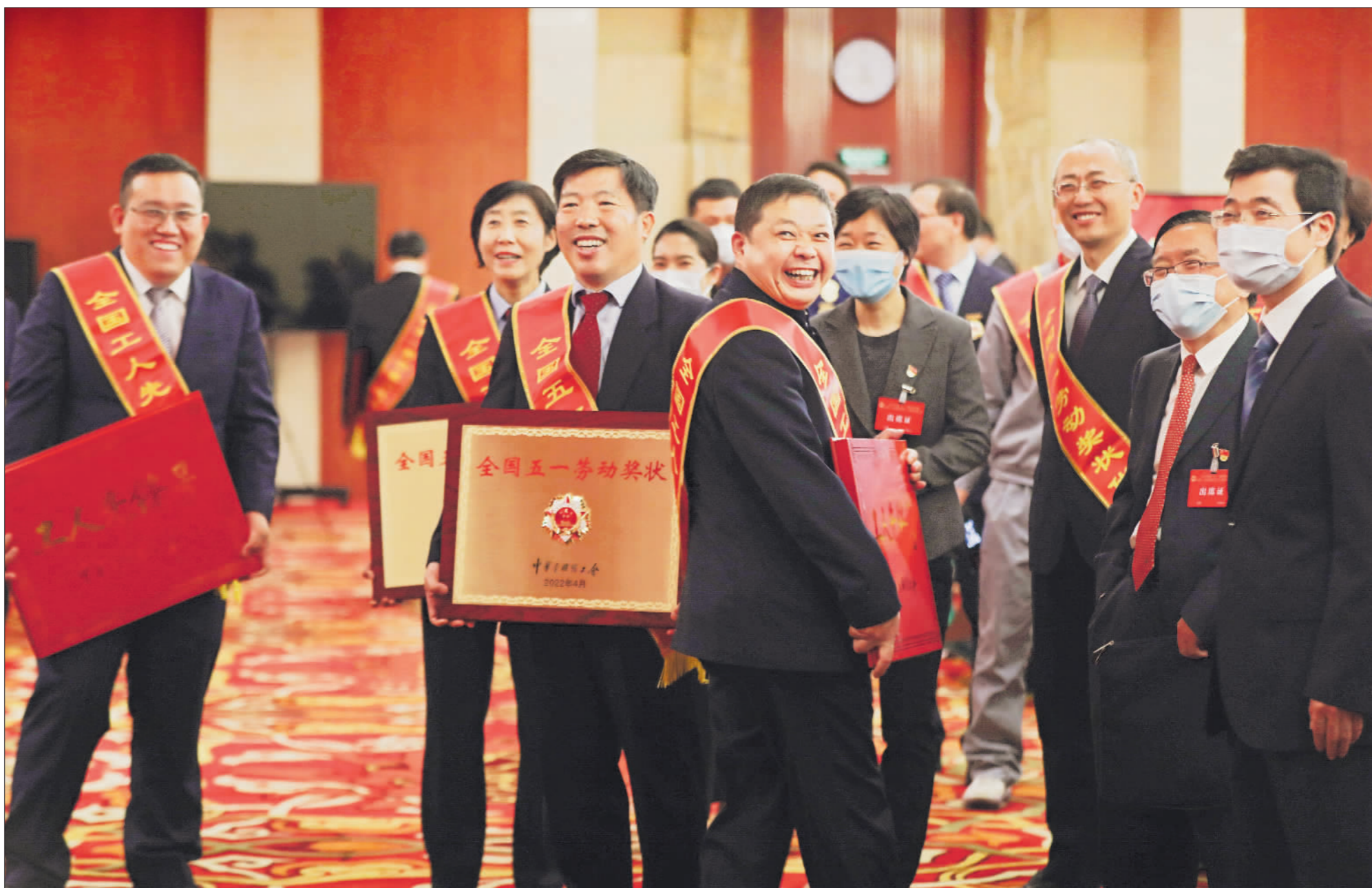
4月28日,2022年庆祝“五一”国际劳动节暨全国五一劳动奖和全国工人先锋号表彰大会以电视电话会议形式在北京召开。大会结束后,部分在京的获奖代表在会场留影。