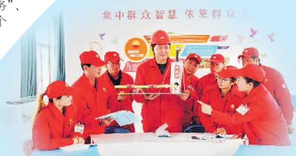
集中群众智慧 依靠群众力量

征途漫漫,惟有奋斗。采油三厂工会积极探索“三服务一加强”高质量落地的创新举措,服务发展大局,维护