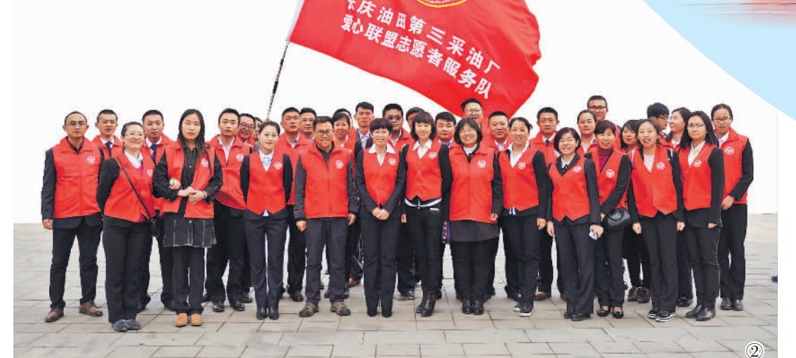
(文/张立文 张雅敏 路心 陈永宏 史慕珂)