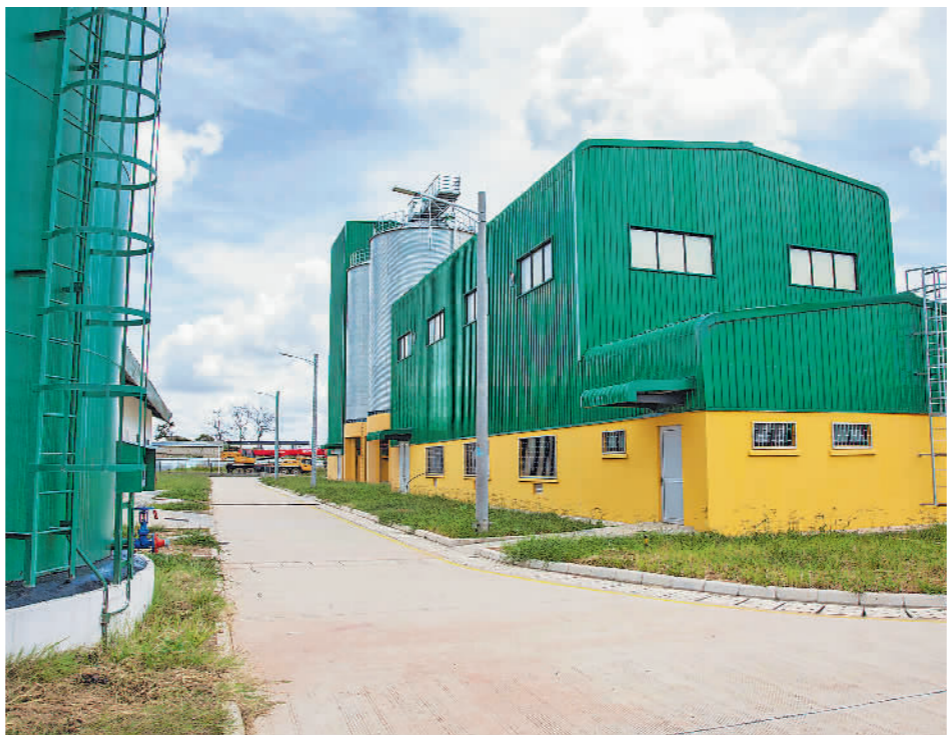
在赞比亚首都卢萨卡拍摄的中国政府援建面粉工厂。