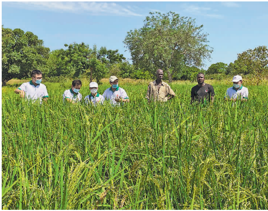
中国专家组成员在布基纳法索中西大区水稻示范区查看苗情。