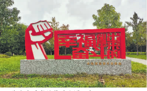
唐山市乐亭县劳动公园一角。