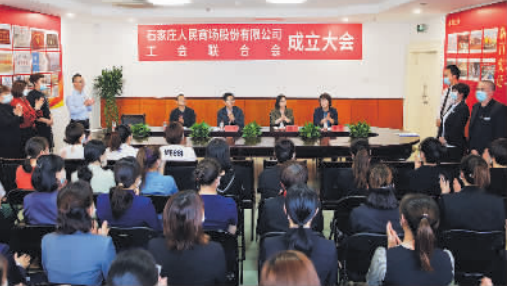
石家庄人民商场股份有限公司成立工会联合会。