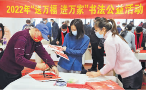
“致敬最美劳动者”——2022年河北省“送万福、进万家”书法公益活动现场。