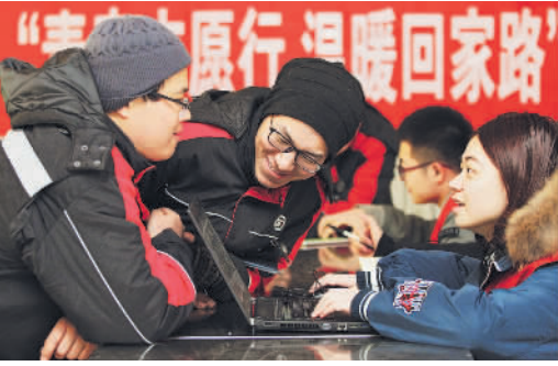
企业工会为新就业形态劳动者代购春运车票。