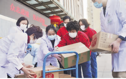
石家庄市第五医院内,劳模志愿者们为一线医护人员送去捐赠物资。