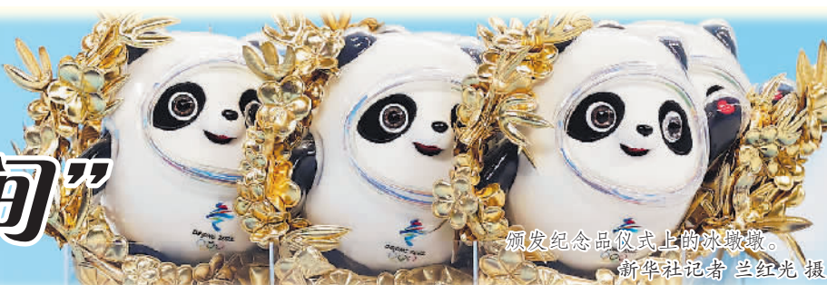
颁发纪念品仪式上的冰墩墩。