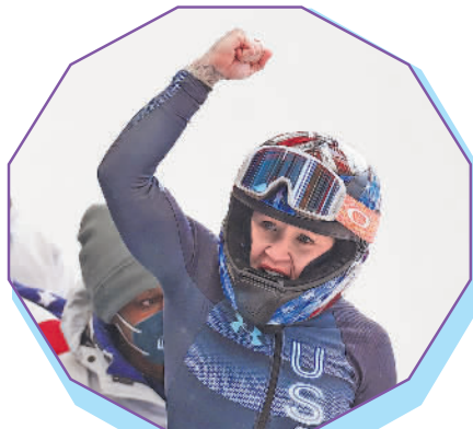
凯莉·汉弗莱斯在比赛后庆祝。