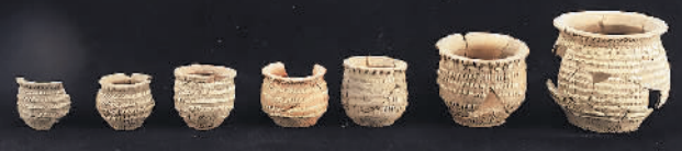
南佐遗址出土器物

这是一处仰韶文化大型聚落遗址,年代距今5200年至4600年。遗址核心区由9座大型夯土台围合,面积约30万平方米,紧邻夯土台外侧发现2道环壕,核心区东、南、北三面约1000米处还发现外环壕遗迹,但目前尚不能确认为封闭的环壕。核心区北部发现大型建筑基址、联排房屋等重要遗迹,其中大型建筑F1包括前厅、后堂,仅室内面积已达630平方米,墙壁、地面均为多层白灰面;F2出土白色堆纹陶、白衣陶、白陶、黑陶、朱砂彩绘陶,大型彩陶罐、带塞盖喇叭口平底彩陶瓶以及大量水稻遗存,显示了较高的社会发展水平。南佐遗址是黄河流域文明起源和发展的重要实物资料,是研究中华五千年文明史和早期国家起源的重大突破。