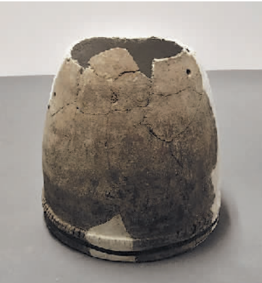
邓槽沟梁遗址出土筒形罐(以上图片由国家文物局提供)

该遗址年代距今8000年至4000年,包括四个阶段面貌各异的考古学文化遗存,主体为1座龙山晚期的石城遗址,年代距今约4200年至4000年。石城依地势建造,城墙宽约13米,墙芯为土石结构。2处保存较好的瓮城平面形状均呈半圆形。城内发现夯土建筑基址1座、房址20座、窑址1座,出土陶器、玉器等各类器物百余件。邓槽沟梁遗址处于我国北方游牧文化和中原农耕文化的过渡地带,是东部环渤海文化和西部内陆文化交流的重要通道。此次发现距今8000年至4000年四个阶段面貌各异的文化遗存,证明该地区自古以来就是多民族、多文化交融的重要区域,为探讨中国北方地区多元一体进程提供了珍贵资料。