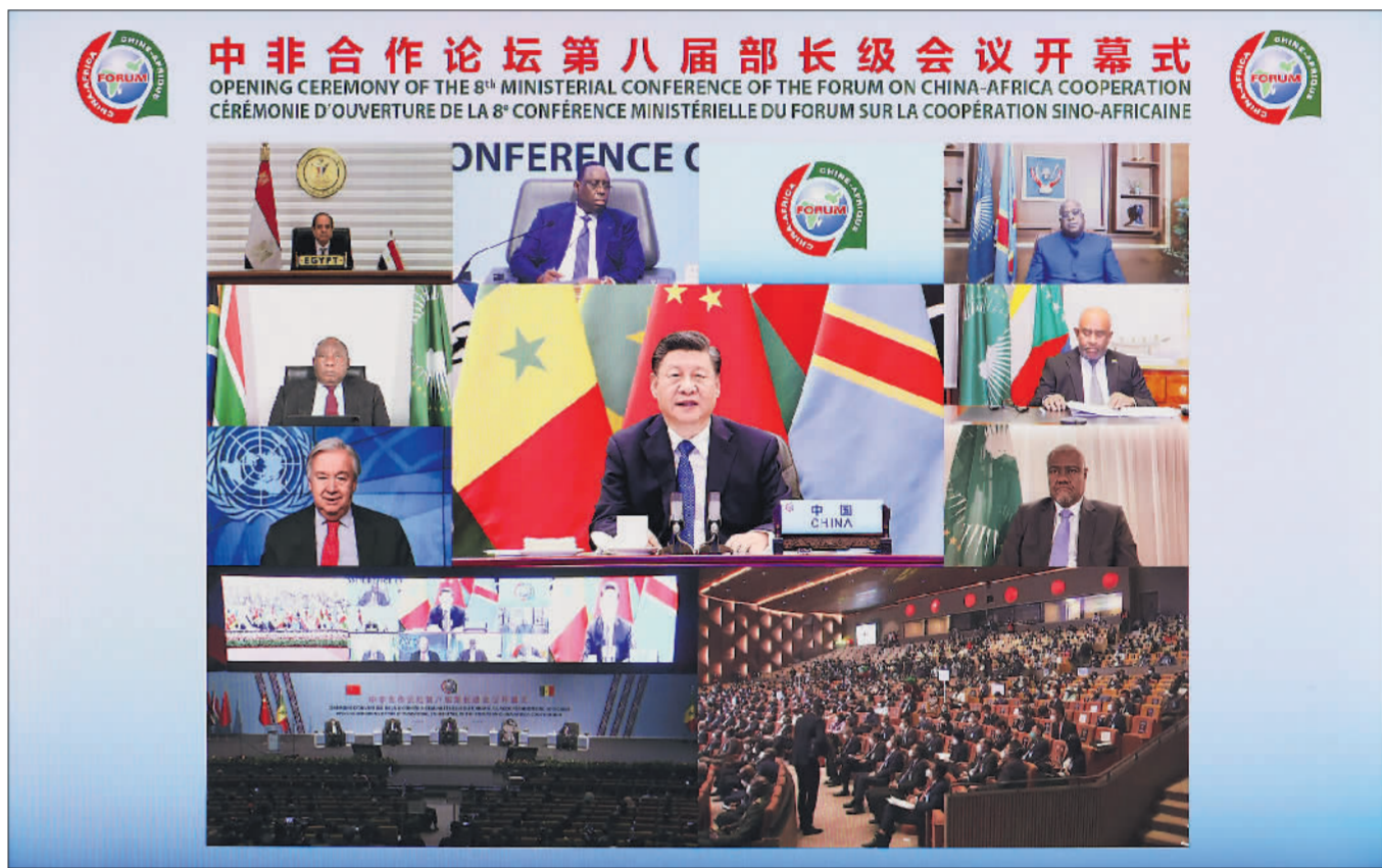
11月29日晚，国家主席习近平在北京以视频方式出席中非合作论坛第八届部长级会议开幕式并发表题为《同舟共济，继往开来，携手构建新时代中非命运共同体》的主旨演讲。

新华社北京11月29日电（记者郑明达）国家主席习近平29日晚在北京以视频方式出席中非合作论坛第八届部长级会议开幕式。 人民大会堂东大厅内，中国和53个非洲国家国旗以及非洲联盟旗帜组成的方阵恢弘大气、热烈奔放，昭示着中非历久弥坚的友好情谊。 习近平发表题为《同舟共济，继往开来，携手构建新时代中非命运共同体》的主旨演讲。（演讲全文另发） 习近平指出，今年是中非开启外交关系65周年。65年来，中非双方在反帝