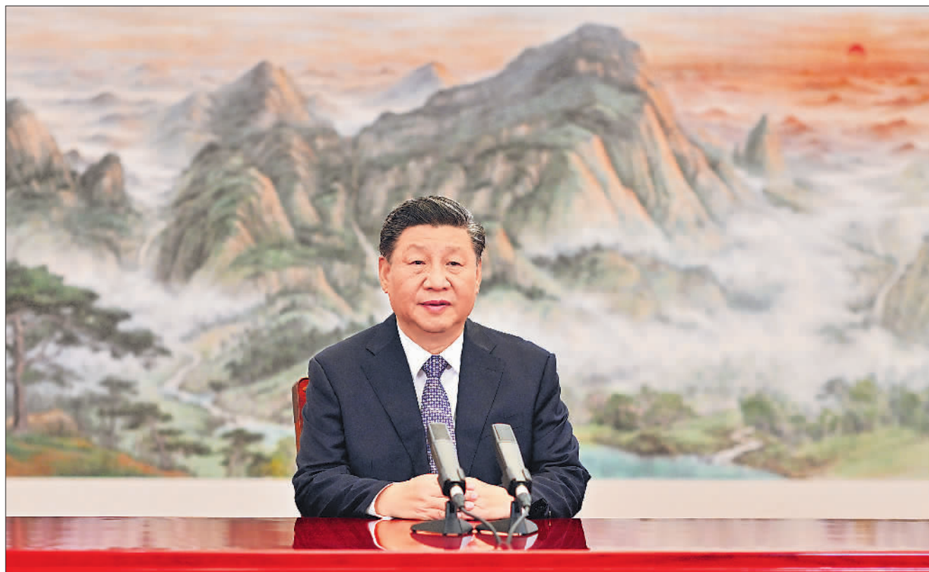
11月11日,国家主席习近平应邀在北京以视频方式向亚太经合组织工商领导人峰会发表主旨演讲。

新华社北京11月11日电 11月11日,国家主席习近平应邀在北京以视频方式向亚太经合组织工商领导人峰会发表题为《坚持可持续发展 共建亚太命运共同体》的主旨演讲。(演讲全文另发)