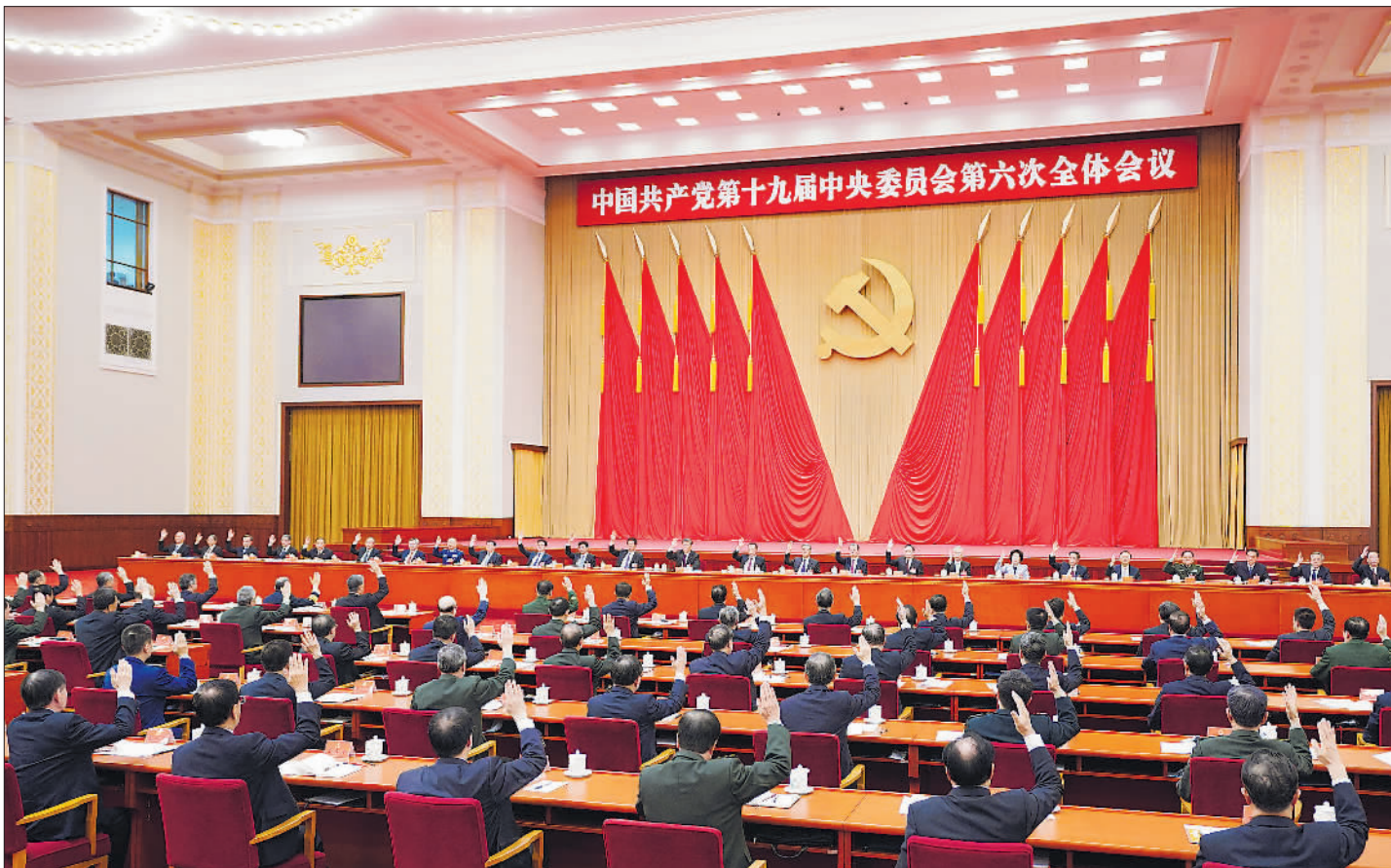
中国共产党第十九届中央委员会第六次全体会议,于2021年11月8日至11日在北京举行。中央政治局主持会议。