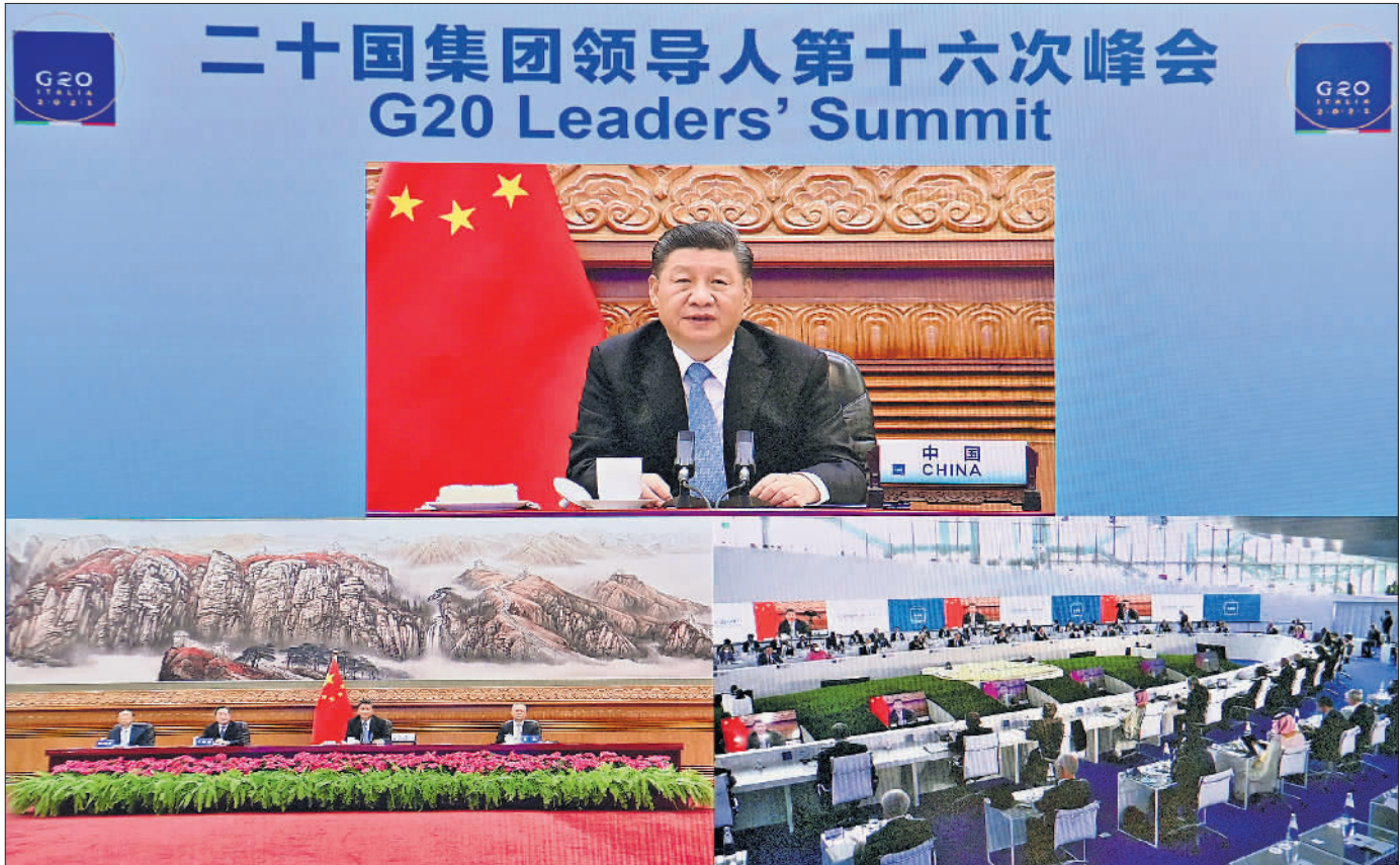
10月31日晚，习近平在北京继续以视频方式出席二十国集团领导人第十六次峰会。