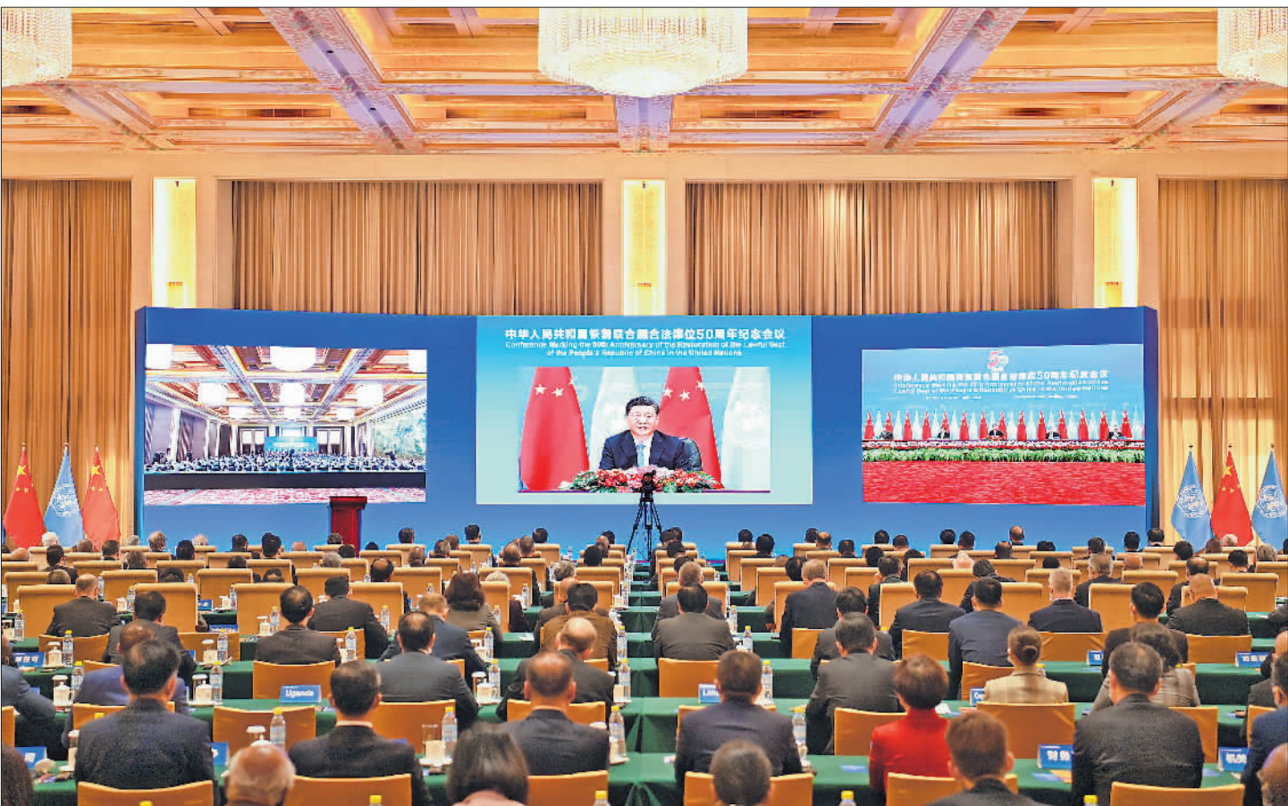
10月25日，国家主席习近平在北京出席中华人民共和国恢复联合国合法席位50周年纪念会议并发表重要讲话。

新华社北京10月25日电 国家主席习近平25日在北京出席中华人民共和国恢复联合国合法席位50周年纪念会议并发表重要讲话。习近平强调，新中国恢复在联合国合法席位以来的50年，是中国和平发展、造福人类的50年。中国将坚持走和平发展之路，始终做世界和平的建设者；坚持走改革开放之路，始终做全球发展的贡献者；坚持走多边主义之路，始终做国际秩序的维护者。中国愿同各国