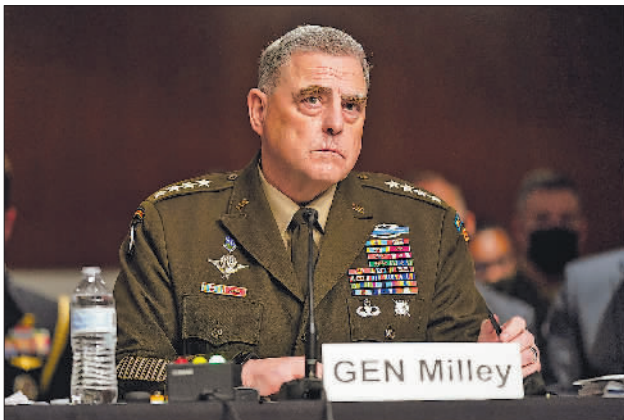
9月28日,美军参谋长联席会议主席马克·米利在美国华盛顿出席国会听证会。

何打着人权旗号服务政治目的的卑劣行径。乌兹别克斯坦表示应尊重各国根据国情自主选择发展道路的权利。加纳表示将人权问题政治化、采用双重标准选择性干涉别国内政的做法损害人权事业发展,完全不可接受。卢旺达表示反对外部势力干涉中国自主处理涉疆、涉港等内部事务。 越南、肯尼亚、乌拉圭、土库曼斯坦、佛得角、柬埔寨、南苏丹等国呼吁各方通过建设性对话与合作促进和保护人权,强调人权理事会工作应遵循普遍性、公正性、客观性、非选择性等原则,应摒弃双重标准,不将人权问题政治化。