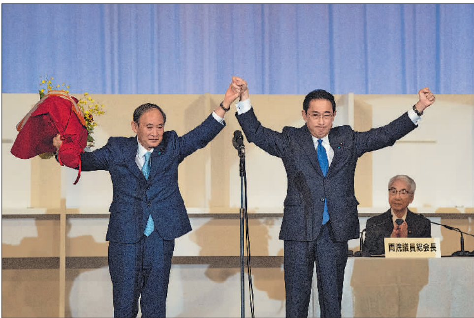
9月29日,岸田文雄(前右)在日本东京当选自民党总裁后接受日本首相菅义伟(前左)的祝贺。

干了4年多。由于在安保、外交等政策上追随安倍,岸田在这一时期开始被认为是“安倍接班人”。 2017年,岸田文雄转任自民党政调会长。2018年自民党总裁选举,岸田文雄在安