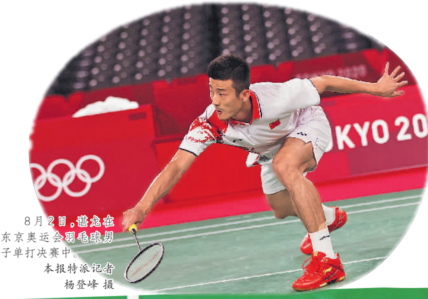
8月2日，谌龙在东京奥运会羽毛球男子单打决赛中。