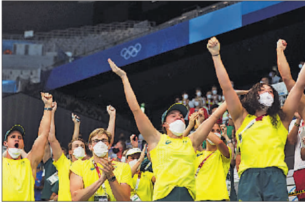
7月29日,在女子800米自由泳比赛中,澳大利亚游泳队队员在看台上为本国选手加油。