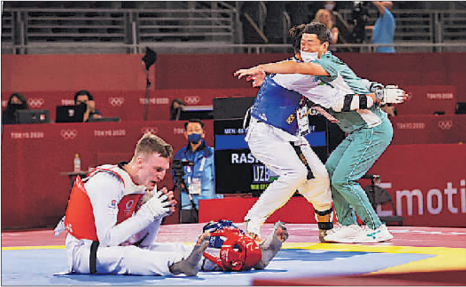
7月25日,在跆拳道男子68公斤级决赛中,英国选手辛登(左一)输掉比赛坐在台上,获得冠军的乌兹别克斯坦小将拉什托夫与教练相拥欢庆胜利。