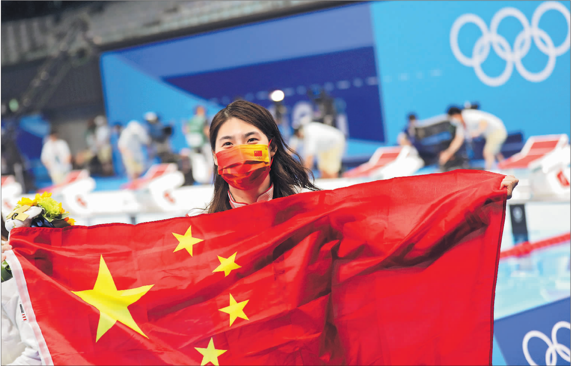
7月29日,在东京奥运会女子200米蝶泳决赛中,张雨霏夺得金牌并破奥运纪录。赛后,张雨霏展示五星红旗庆祝胜利。