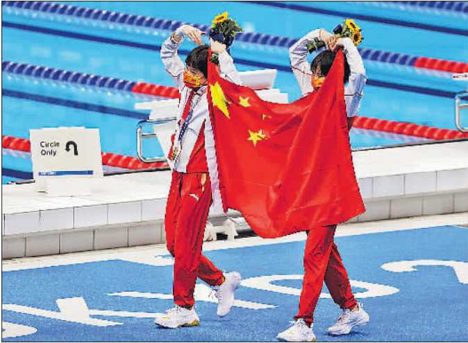
7月27日,张家齐、陈芋汐夺得跳水女子双人10米台冠军后,一起持五星红旗向场外比心。