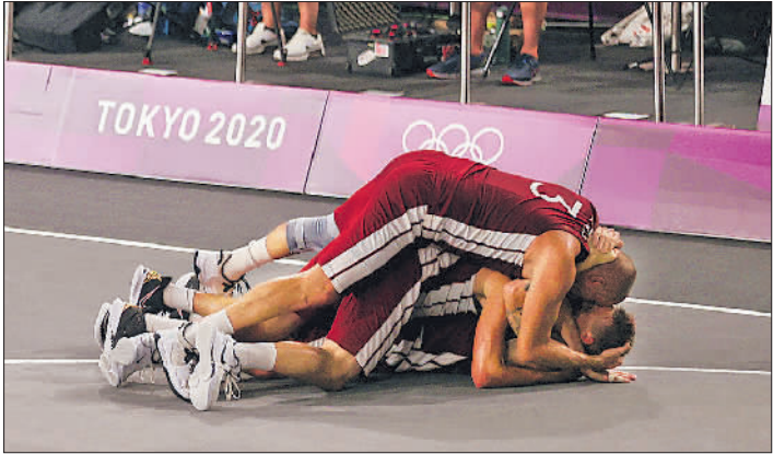
7月28日,在奥运会新增项目三对三篮球决赛中,拉脱维亚队的队员们获胜后倒地庆祝。