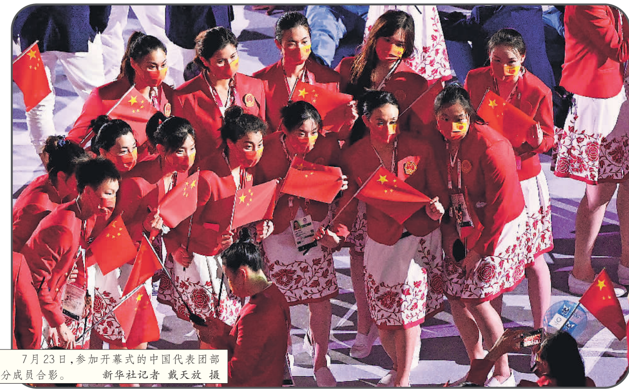
7月23日，参加开幕式的中国代表团部分成员合影。