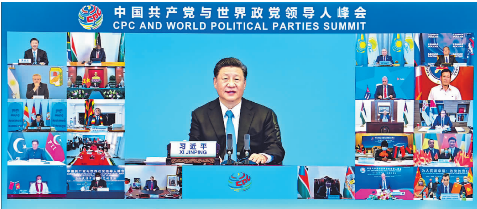
7月6日,中共中央总书记、国家主席习近平在北京出席中国共产党与世界政党领导人峰会并发表主旨讲话。