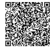
“两优一先”名单请扫码 见工人日报新闻客户端