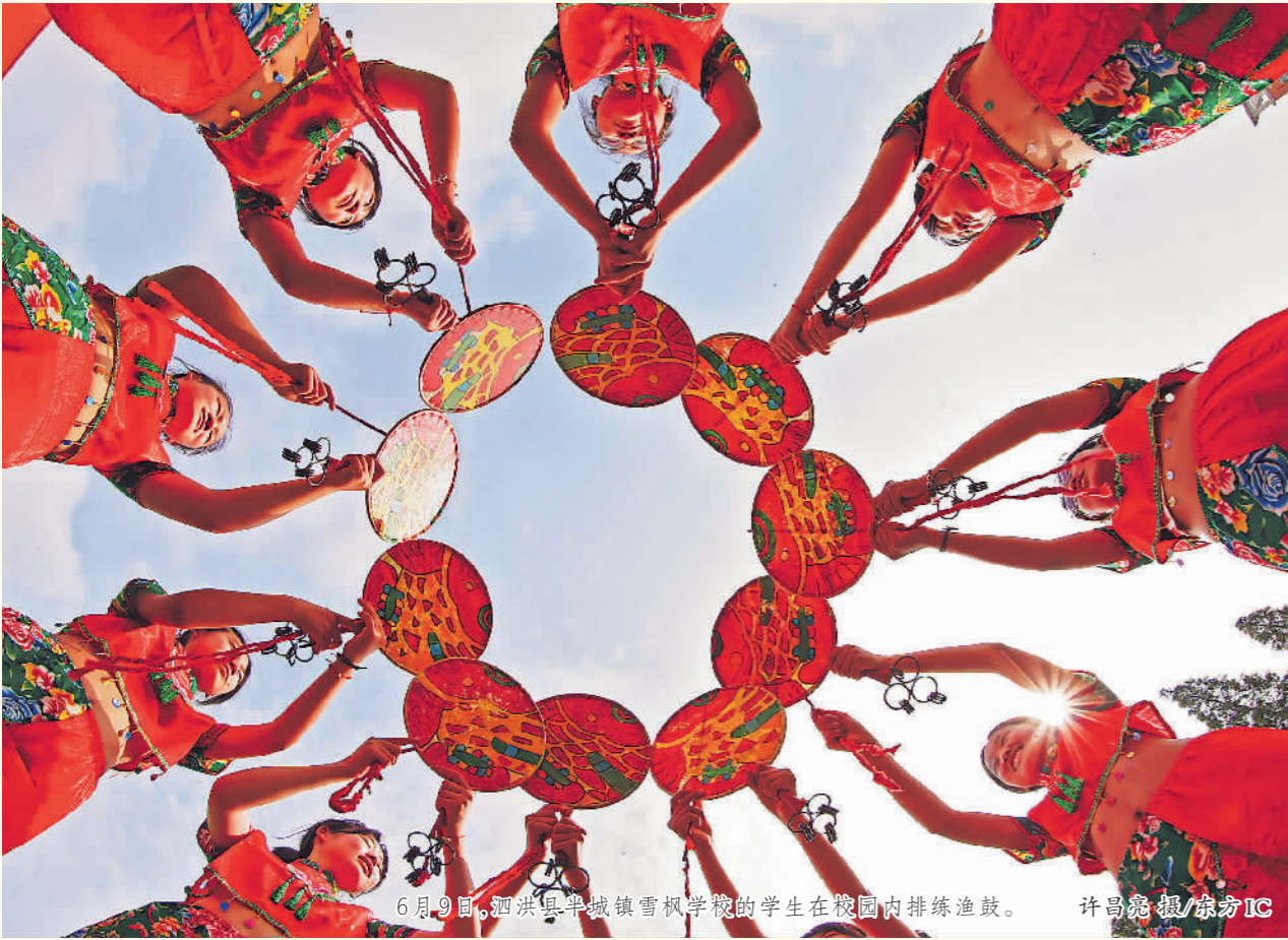
6月9日,泗洪县半城镇雪枫学校的学生在校内排练渔鼓。

在电影的娱乐功能可以通过商业回馈得以彰显的今天,如何让文化和艺术的思想、教化意义发挥功用,如何于历史中得到共情,理解他们的经历,需要我们走进电影院,以一种很多人齐聚在一起的方式,没有弹幕、没有快进,静静地看他们的故事。