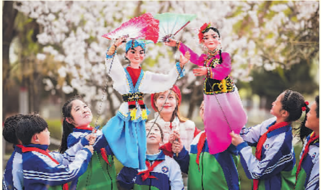
内蒙古呼和浩特市玉泉区通顺街小学学生在体验杖头木偶操纵技艺。

6月12日,第十六个文化和自然遗产日到来。各地纷纷举行形式多样的非遗宣传、展示、传承活动。文化和自然遗产日源自文化遗产日,是每年6月的第二个星期六,旨在增强全社会的文化遗产保护意识。