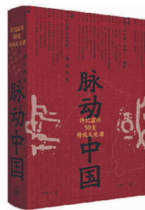
《脉动中国》 许纪霖 著 上海三联书店

本书从纵向讲中国文化的过去、现代和将来。从当下的问题意识反思中国文化的过去,从文化的传统展望中华民族的未来。从横向提供了一个打通千年历史、站在高处俯瞰中国文化的系统性框架,揭秘中国人的道德心灵秩序和社会政治秩序。