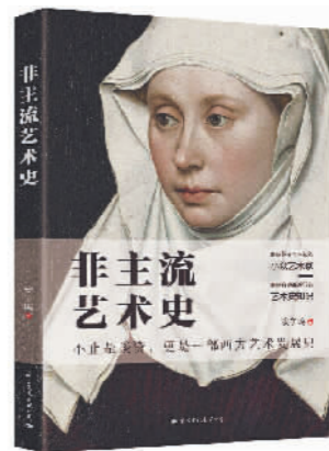
《非主流艺术史》 安争鸣 著 国际文化出版公司

不拘于文学,本书试图用哲学来引导文学实现理论高度的提升,使得文学创作不再只依赖先验主义所带来的感性认识。另外,本书采用的对话录形式,规避了理论的枯燥,对各种有关哲学和文学的话题都是深入浅出,娓娓道来。