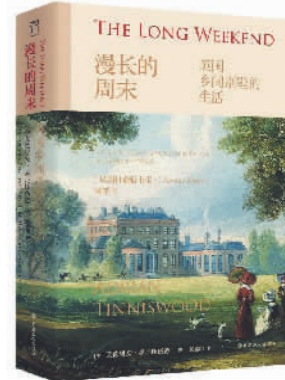
《漫长的周末》 [英]艾德里安·泰尼斯伍德 著 杨盛翔 译 中国工人出版社

本书探究了20世纪初期两次世界大战期间英国贵族在乡间别墅的生活,是一部活色生香的英国生活史。作者以乡间别墅生活为主题,展现了英国贵族生活方式,以及在社会变革期间,传统和现代的碰撞与融合。