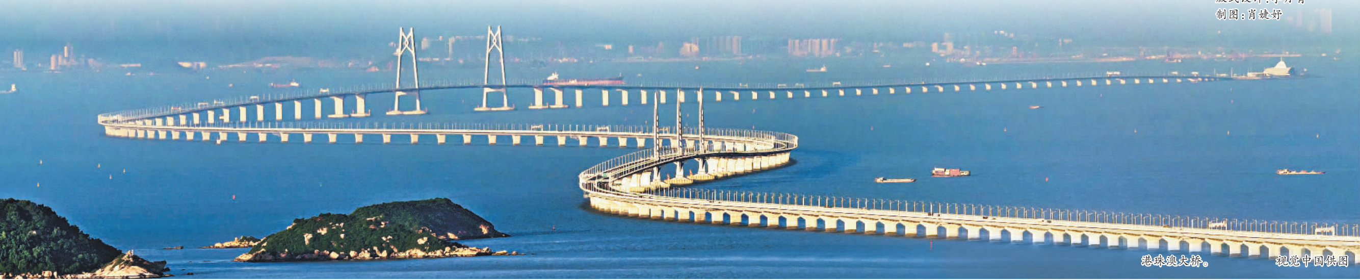
港珠澳大桥。