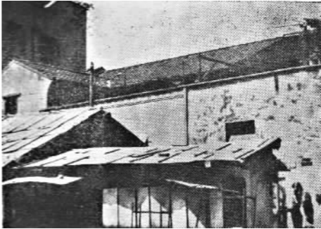
中国劳动组合书记部旧址位于上海市成都北路新闻路口,图为旧照片。

中国劳动组合书记部的名字是共产国际代表马林起的,“劳动组合”即工会之意,“书记部”即秘书处的意思。中国劳动组合书记部在上海成立后,相继在北京、长沙、武汉、广州、济南等地设立了分部机构,将工人运动的火种播向全国各地。