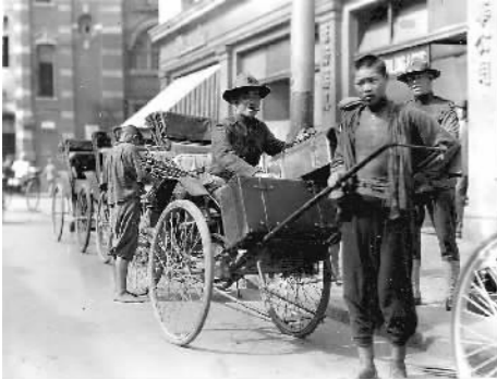
民国时期的上海黄包车夫。

从成立到结束的3年零9个月时间里,中国劳动组合书记部通过各种形式向工人进行马列主义宣传和教育,帮助工人组织工会,在年轻的中国共产党的领导下,进行了一系列的反帝反军阀斗争,为壮大党的事业和工人阶级自身的解放做了大量的工作,在中国工运史上谱写下壮丽诗篇。