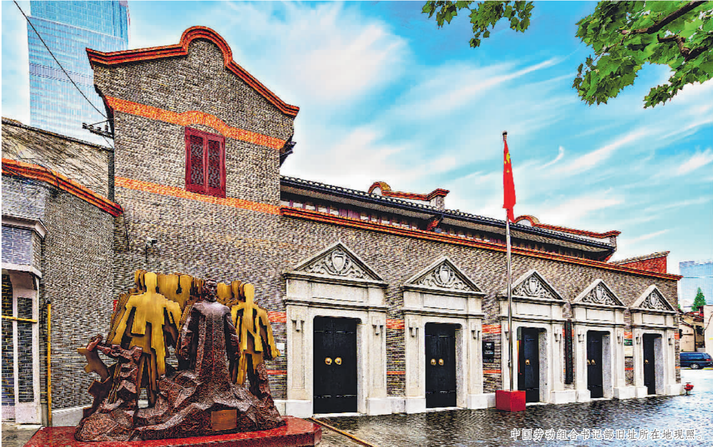
中国劳动组合书记部旧址所在地现照。

砖瓦无声,岁月有痕。中国劳动组合书记部旧址陈列馆,真实展现了书记部在中国共产党的领导下,组织产业工会,开展罢工斗争,出版工人刊物,举办工人学校,发起全国劳动大会,开展劳动立法运动,掀起中国工人运动第一个高潮的光辉历程。