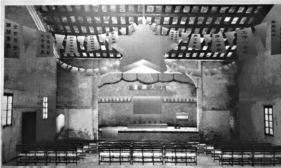
第一次全国劳动大会会场。

当时的成都北路位于五大工业区居中心位置,该地门前还有有轨车站,可以方便发动市内各处工人运动。在这里办公,能最快最近走入工人中去,听到最真实的声音,扎实开展工作。