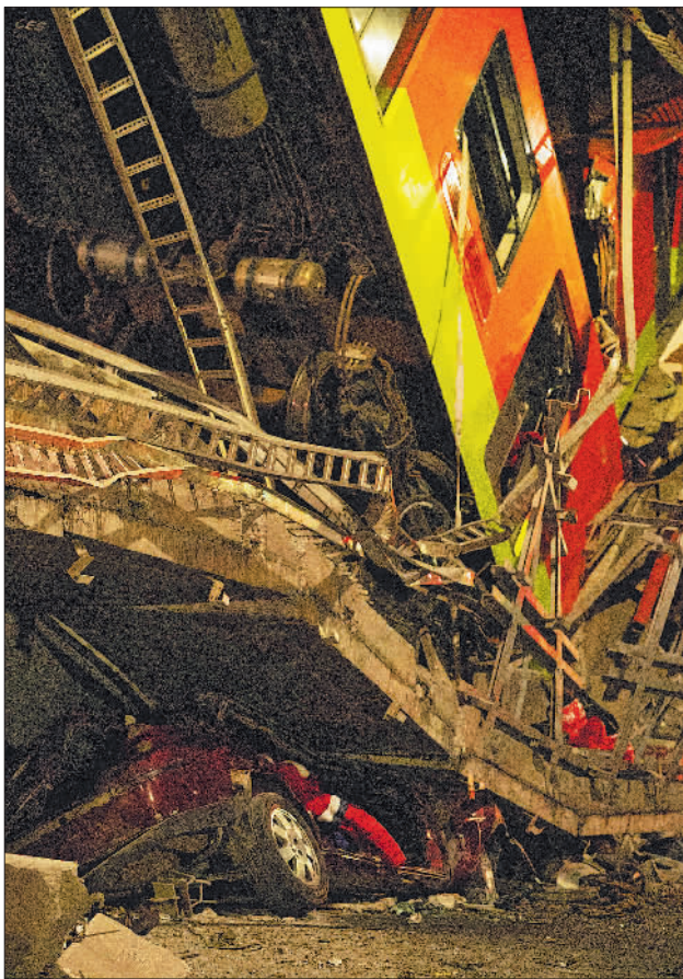
这是5月3日晚在墨西哥首都墨西哥城拍摄的坍塌现场。