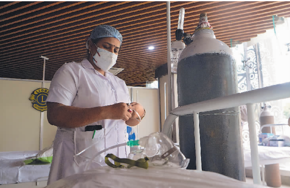
5月3日,医务人员在印度加尔各答为新冠患者准备氧气。据印度卫生部4日公布的数字,印度累计新冠确诊病例超过2000万例。