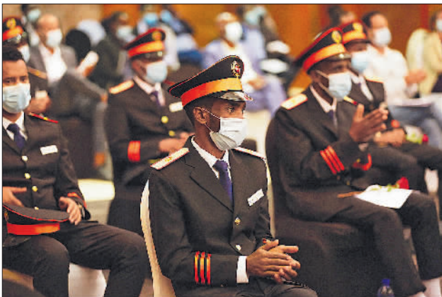
5月4日,火车司机在埃塞俄比亚首都亚的斯亚贝巴参加证书颁发仪式。