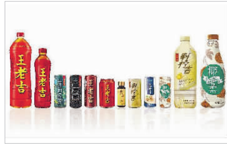
王老吉大健康公司旗下产品

响应国家号召,王老吉大健康勇担社会责任,积极投入到脱贫攻坚、乡村振兴之中,创新打造“输血+造血式”产业帮扶模式,多年