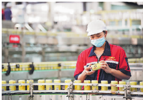
贵州惠水县刺柠吉生产基地。

来累计投资15亿元,先后在四川雅安、广东梅州、甘肃兰州建立生产基地,带动当地经济和就业。