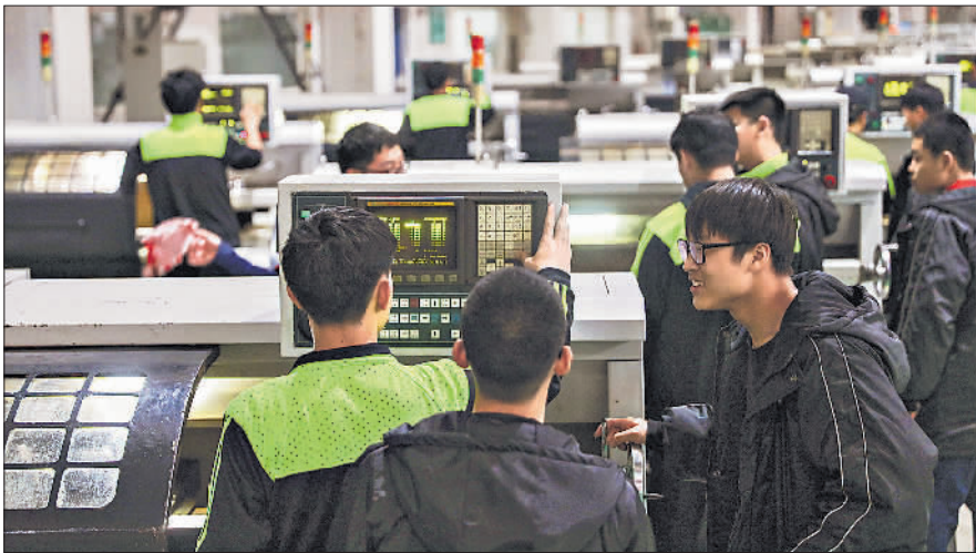
3月30日,在沈阳市装备制造工程学校,同学们在机床前实习操作。