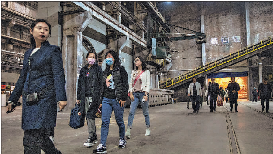
4月1日,中国工业博物馆内,游客在讲解员的带领下参观老厂房。这座由原沈阳铸造厂改建的博物馆,不仅见证了铁西工业的发展,也承载着人们对于铁西工业的记忆。