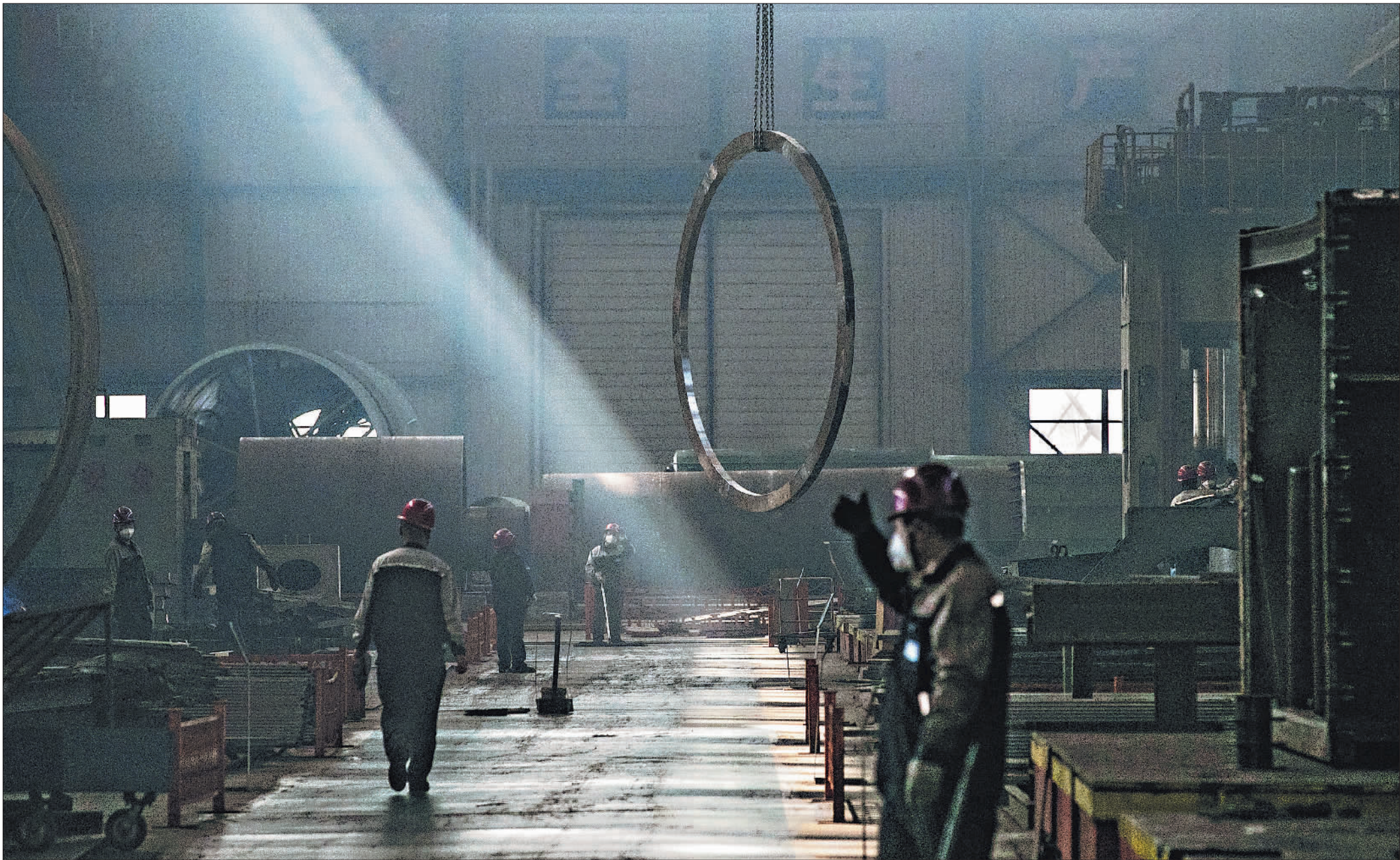
3月31日,北方重工集团有限公司的一个车间内,工人正在吊运法兰环。经过近两年的改革,曾为新中国重型工业发展做出卓越贡献的北方重工,通过实施“混改”迈入了新的发展阶段。