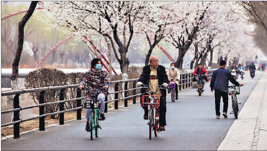
4月1日,铁西区卫工北街的一处马路旁,各种花卉竞相绽放,春意盎然。