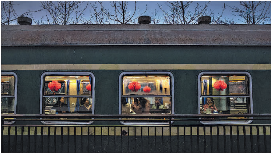
4月1日,红梅文创园内,一家美容公司的职员们正在由绿皮车厢改造的餐厅内聚餐。