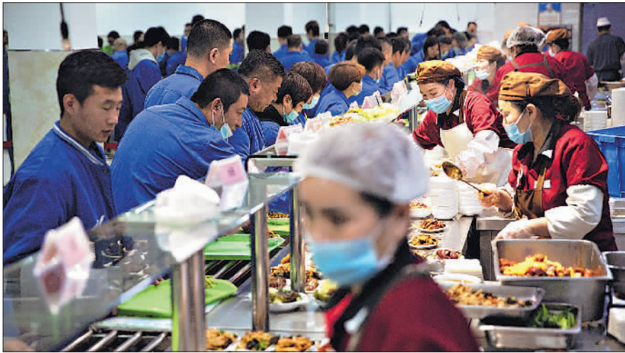
3月31日中午,沈阳鼓风机集团的食堂内,工人们在选购菜品。集团食堂实行“混改”后,职工的一日三餐有了更多选择。