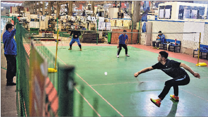
3月31日,沈阳鼓风机集团的一个车间内,工人们利用休息时间锻炼。