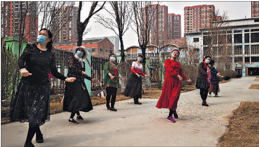
4月1日,红梅文创园内,几名退休职工在练习广场舞。2019年底,有着80年历史的原沈阳红梅集团通过改造变身文创园,成为铁西区著名的网红打卡地。