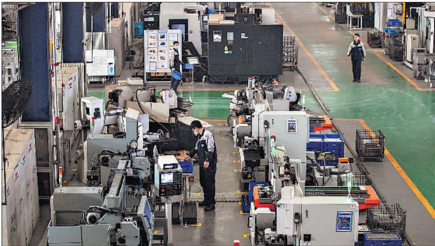
3月31日,北方重工汽车零部件生产车间内,工人通过智能数控设备加工零件。