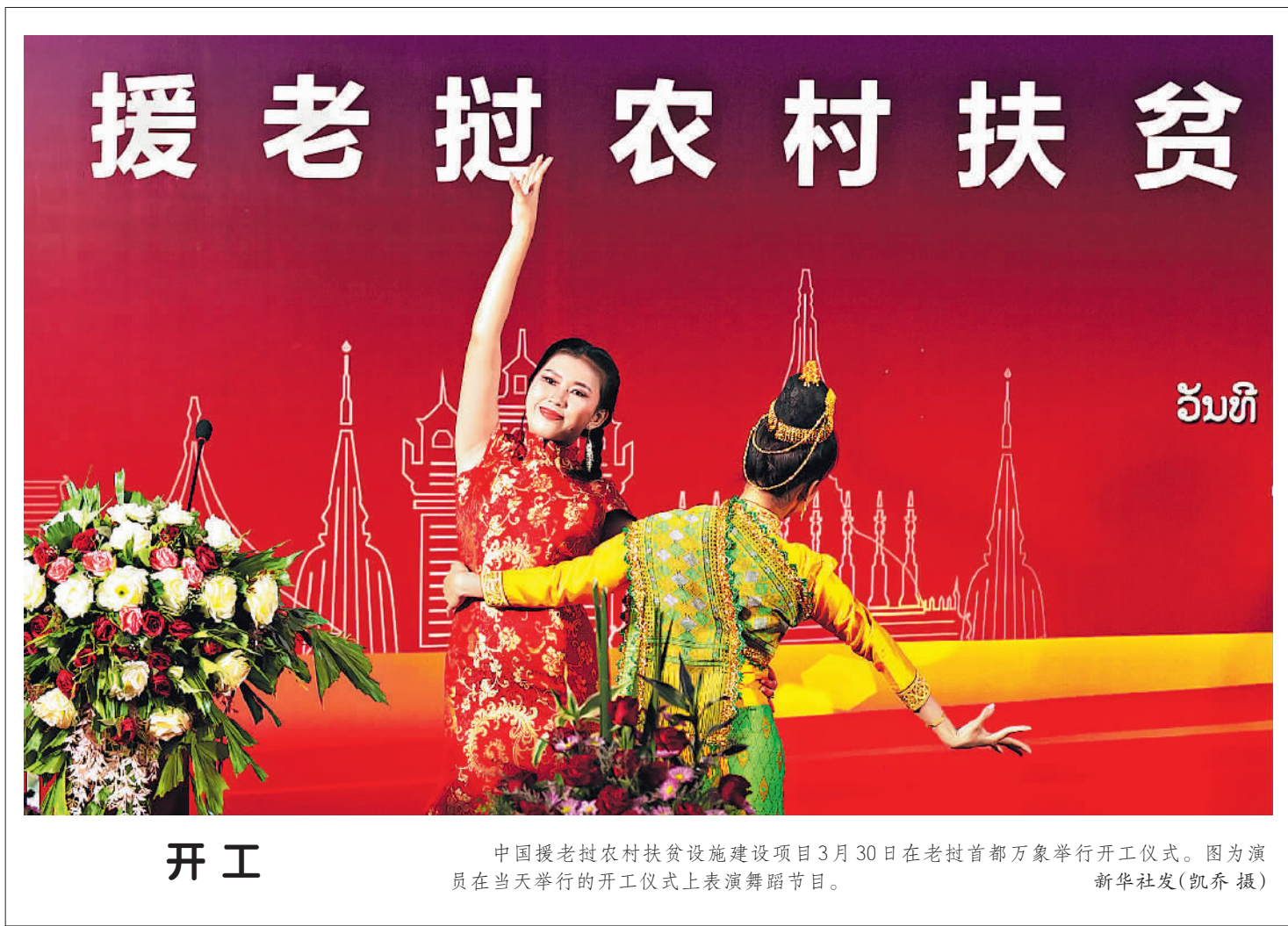
中国援老挝农村扶贫设施建设项目3月30日在老挝首都万象举行开工仪式。图为演员在当天举行的开工仪式上表演舞蹈节目。

需要警惕的是,面对高额债务形势,美国处理方式不是通过传统的压缩支出、大幅提高税收“过紧日子”,而是凭借美元国际地位,美联储直接大幅购买美债资产,通过债务货币化的方式稀释债务负担,损害他国应对危