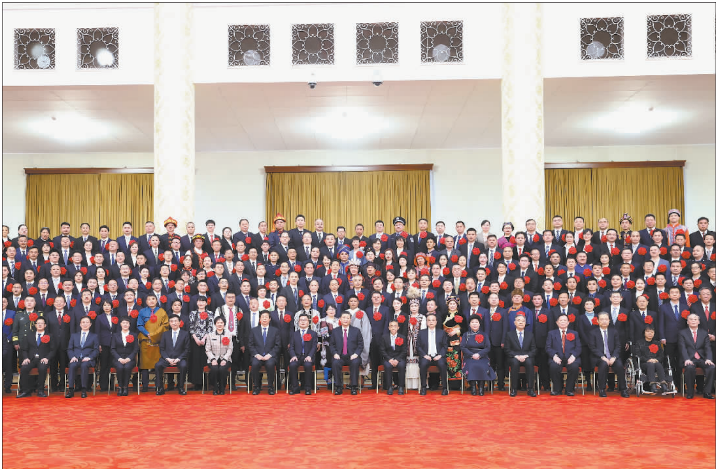
2月25日,全国脱贫攻坚总结表彰大会在北京人民大会堂隆重举行。会前,习近平等会见全国脱贫攻坚楷模荣誉称号获得者,全国脱贫攻坚先进个人、先进集体代表,全国脱贫攻坚楷模荣誉称号个人获得者和因公牺牲全国脱贫攻坚先进个人亲属代表等,并同大家合影留念。