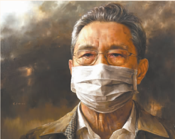
中国共产党党员——钟南山