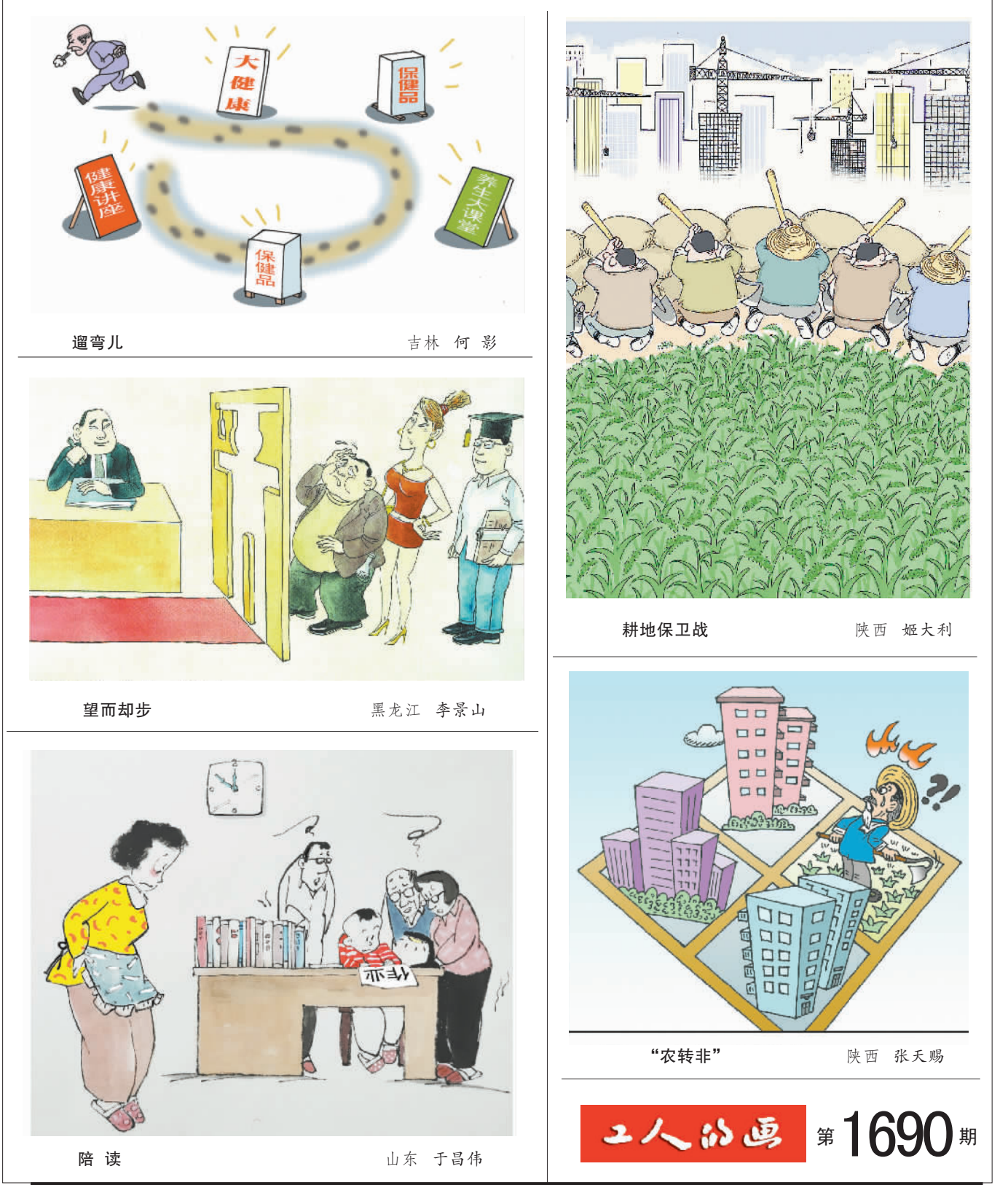
遛弯儿 吉林 何影

诸位同仁每天此时此刻地领取铁钩,自我勾成笑脸逐渐的模样。这是上班谄媚上司?还是下班糊弄妻儿老小?【克罗地亚】帕维奇