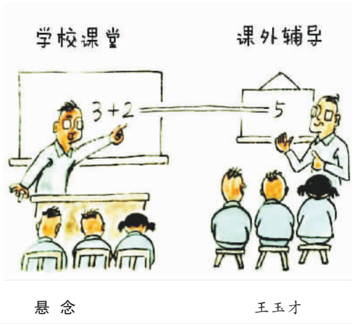
悬 念 王玉才

无论小说,还是戏剧,悬念都是引起人们关注的重要元素。同样的道理,取材于生活的漫画,制造悬念也是作者追求之一。不过,很多不该有悬念的生活,一旦染上悬念,这样的生活就需要重新审视、评判甚至嘲讽。漫画家王玉才先生的作品《悬念》,或许给了我们这一次机会。 好吧,我们先来旁听一堂课,或许一堂课未必解决问题。 老师来了。今天的课非常重要,重要到什么程度呢?可以说几乎决定你们今后整个数学学习的走向和成败。换句话说,这个问题搞不懂,搞不清楚,或者说一知半解,不仅影响到你们的学习,无疑也将影响你们的生活,你们未来的工作。不是危言耸听,这个问题解决不好,甚至在遥远的将来会导致一场接一场的灾难。请看黑板,3加2等于几?由于时间关系,想了解结果的同学,可以参加我的补课班。 3+2等于几?这个问题本来不该有悬念,尤其面对经验丰富的数学教师。然而很不幸,悬念已经走入课堂,走向讲台。在某些善于制造悬念的教师笔下,这个等号变得狭长、悠长且漫长,好似一场无法确定的体育比赛,人们被等号拖入了加时赛——老师精心准备的补课班。加时赛来了,问题也来了。那些想急于了解比分的孩子,毫无悬念地要再买一张加时赛的人场券。 我相信如此拙劣的行为并非普遍存在,但我坚信谈论这个问题仍具普遍意义。旁听者中的医生会想:如果我为患者做手术,开刀和缝合分两个场所进行会怎么样?旁听者中的歌手回想:我真傻,上次的音乐会,不仅唱满全场,加演了两首歌也没有额外收费;旁观的公务员会想,以后让市民到政务中心填表,回到家里盖章,一定会有更多“契机”。 1200年前,韩愈先生就给我们提了个醒,“师者,传道授业解惑也”。作为一名教师,万万不可授业不成,增加学子疑惑,还伤害了为师之道。更为值得警惕的是,教师的工作极具传播性和传承属性。如果说损害职业道德是病毒,病毒在学校更容易传播。 漫画是夸张的艺术,《悬念》揭示的问题,可以被看作一种病毒。染上这种病,该治疗治疗,该隔离隔离。没有这病当然更好,就当成疫苗来看吧。