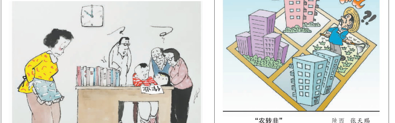
“农转非” 陕西 张天赐