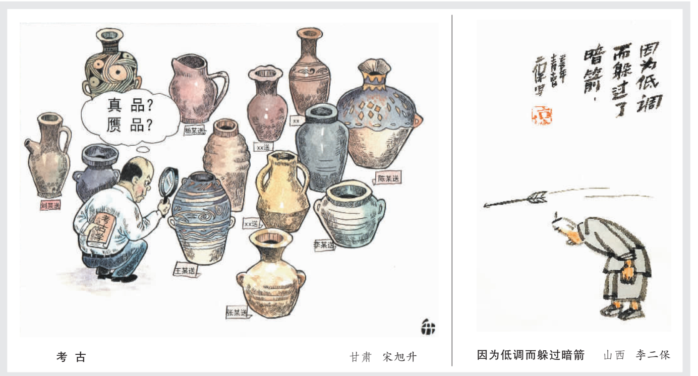
考 古 甘肃 宋旭升 因为低调而躲过暗箭 山西 李二保

无论小说,还是戏剧,悬念都是引起人们关注的重要元素。同样的道理,取材于生活的漫画,制造悬念也是作者追求之一。不过,很多不该有悬念的生活,一旦染上悬念,这样的生活就需要重新审视、评判甚至嘲讽。漫画家王玉才先生的作品《悬念》,或许给了我们这一次机会。 好吧,我们先来旁听一堂课,或许一堂课未必解决问题。 老师来了。今天的课非常重要,重要到什么程度呢?可以说几乎决定你们今后整个数学学习的走向和成败。换句话说,这个问题搞不懂,搞不清楚,或者说一知半解,不仅影响到你们的学习,无疑也将影响你们的生活,你们未来的工作。不是危言耸听,这个问题解决不好,甚至在遥远的将来会导致一场接一场的灾难。请看黑板,3加2等于几?由于时间关系,想了解结果的同学,可以参加我的补课班。 3+2等于几?这个问题本来不该有悬念,尤其面对经验丰富的数学教师。然而很不幸,悬念已经走入课堂,走向讲台。在某些善于制造悬念的教师笔下,这个等号变得狭长、悠长且漫长,好似一场无法确定的体育比赛,人们被等号拖入了加时赛——老师精心准备的补课班。加时赛来了,问题也来了。那些想急于了解比分的孩子,毫无悬念地要再买一张加时赛的人场券。 我相信如此拙劣的行为并非普遍存在,但我坚信谈论这个问题仍具普遍意义。旁听者中的医生会想:如果我为患者做手术,开刀和缝合分两个场所进行会怎么样?旁听者中的歌手回想:我真傻,上次的音乐会,不仅唱满全场,加演了两首歌也没有额外收费;旁观的公务员会想,以后让市民到政务中心填表,回到家里盖章,一定会有更多“契机”。 1200年前,韩愈先生就给我们提了个醒,“师者,传道授业解惑也”。作为一名教师,万万不可授业不成,增加学子疑惑,还伤害了为师之道。更为值得警惕的是,教师的工作极具传播性和传承属性。如果说损害职业道德是病毒,病毒在学校更容易传播。 漫画是夸张的艺术,《悬念》揭示的问题,可以被看作一种病毒。染上这种病,该治疗治疗,该隔离隔离。没有这病当然更好,就当成疫苗来看吧。