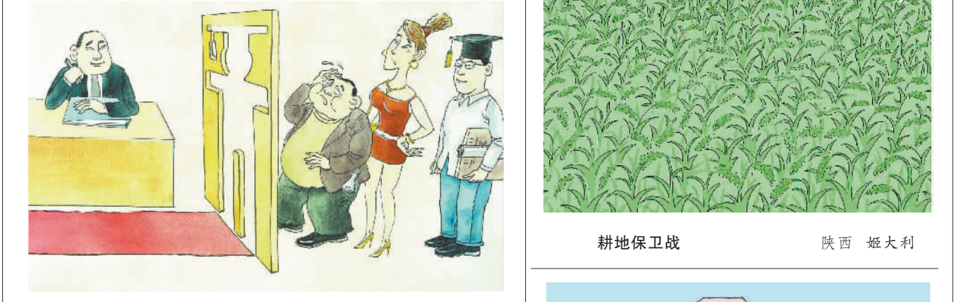
望而却步 黑龙江 李景山