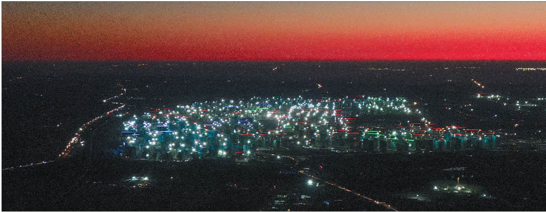
↓12月3日黎明,24小时作业的雄安新区容东片区即将迎来新的一天。