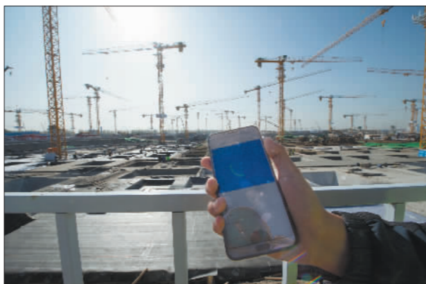
11月3日,雄安新区一安置房项目工地,管理人员通过“雄安建设”客户端实时查看环境监测数据。