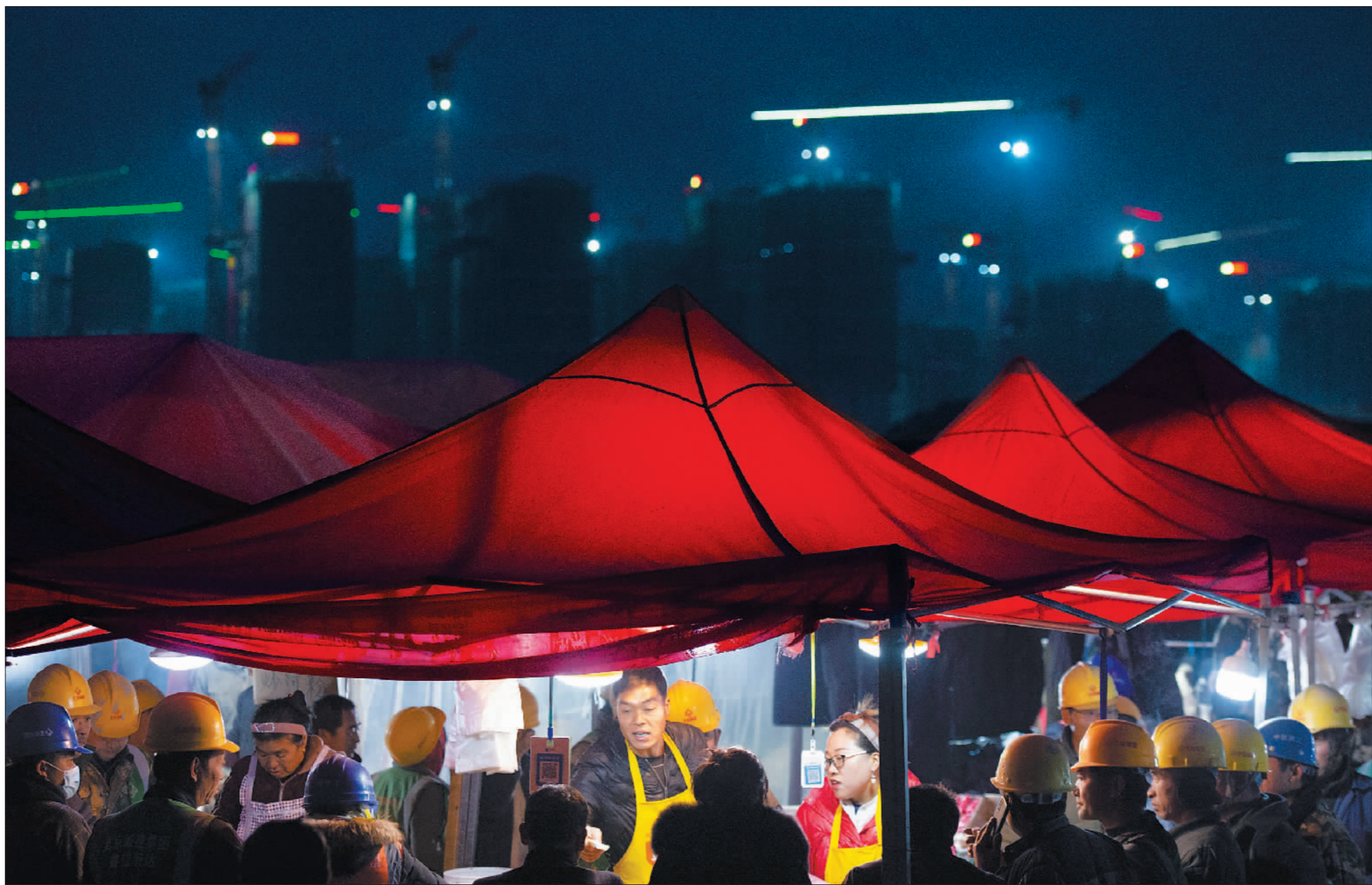
12月5日,夜幕刚刚降临。雄安新区容东片区的一处工友集市内,在周边项目上作业的工友们汇集而来,在这里购买晚餐和一些生活用品。

“这些工人是在建设我们的家,我们做点小生意,管饱那是必须的!”一个来自容城的老板说。