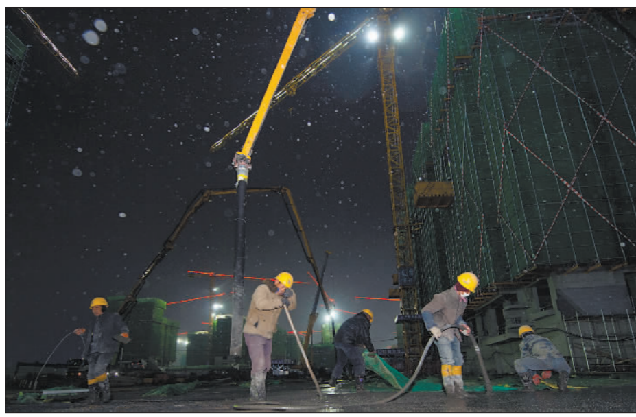
←12月1日23时,雄安新区夜间降雪,在中铁建工集团承建的容东片区E组团安置房项目上,混凝土浇筑作业照常进行。