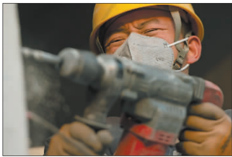
12月6日,电钻工戴着KN95口罩作业。

初冬的白洋淀,芦苇泛黄,波光潋滟,偶有水鸟掠过水面,把这华北明珠映衬得更加静谧安详。