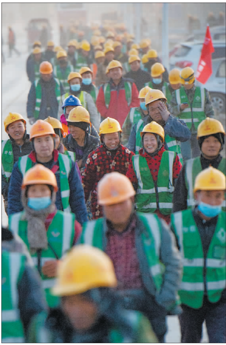
12月3日傍晚,浩浩荡荡的工人队伍走在前往工友集市和宿舍的通道上。