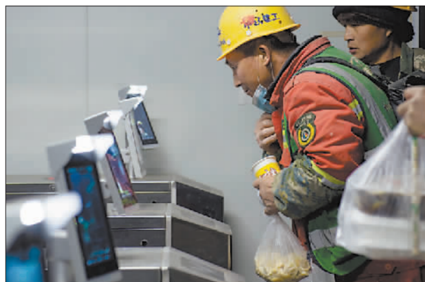
12月2日,一名工人下班后通过人脸识别闸机穿过实名制通道。