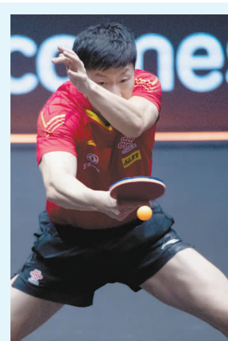
11月29日,马龙在中国澳门进行的WTT澳门国际乒乓球赛男单决赛中夺得冠军。

无限接近史上最佳的马龙要继续前行,就需要忘掉过去,打碎那个曾经无比辉煌的自己,以今日之我与昨日之我战。这个过程有多难,或许只有马龙本人最清楚。