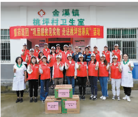
↑重药集团“巩固脱贫见实效 走进桃坪送春风”活动

多年来,重药集团围绕“打造国内一流、国际知名的医药健康产业集团”的企业愿景,秉承“献身医药,追求卓越”的企业精神,全体干部职工不忘初心、顽强拼搏,在不断提高企业医药全产业链服务能力的同时,磨砺出一支充满激情活力、敢打硬仗、能打硬仗的干部队伍,为实现企业从优秀到卓越、为祖国医药健康事业发展贡献最大力量。