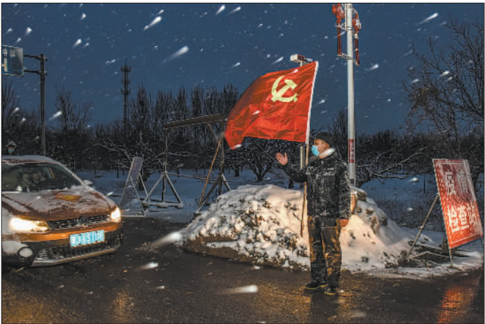
银奖 《雪夜坚守》 作者:王占林