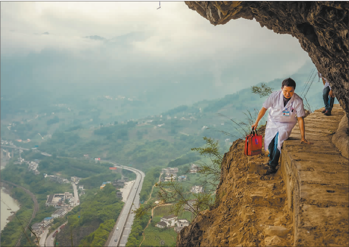
金奖 《巡诊路上》 作者:王国辰