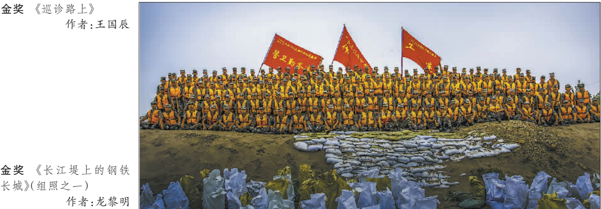
金奖 《长江堤上的钢铁长城》(组照之一) 作者:龙黎明