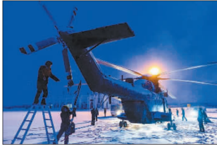
优秀奖 《零下40度绽放生命异彩》 作者:汤向伟