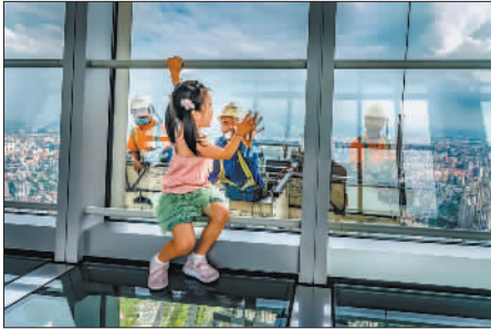
铜奖 《小手和大手》 作者:原方