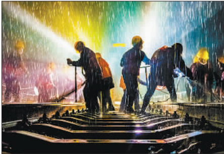
铜奖 《风雨担当》 作者:贾佳