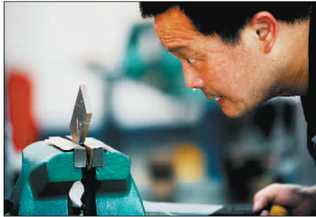
银奖 《金属绣丝》 作者:盛铁军