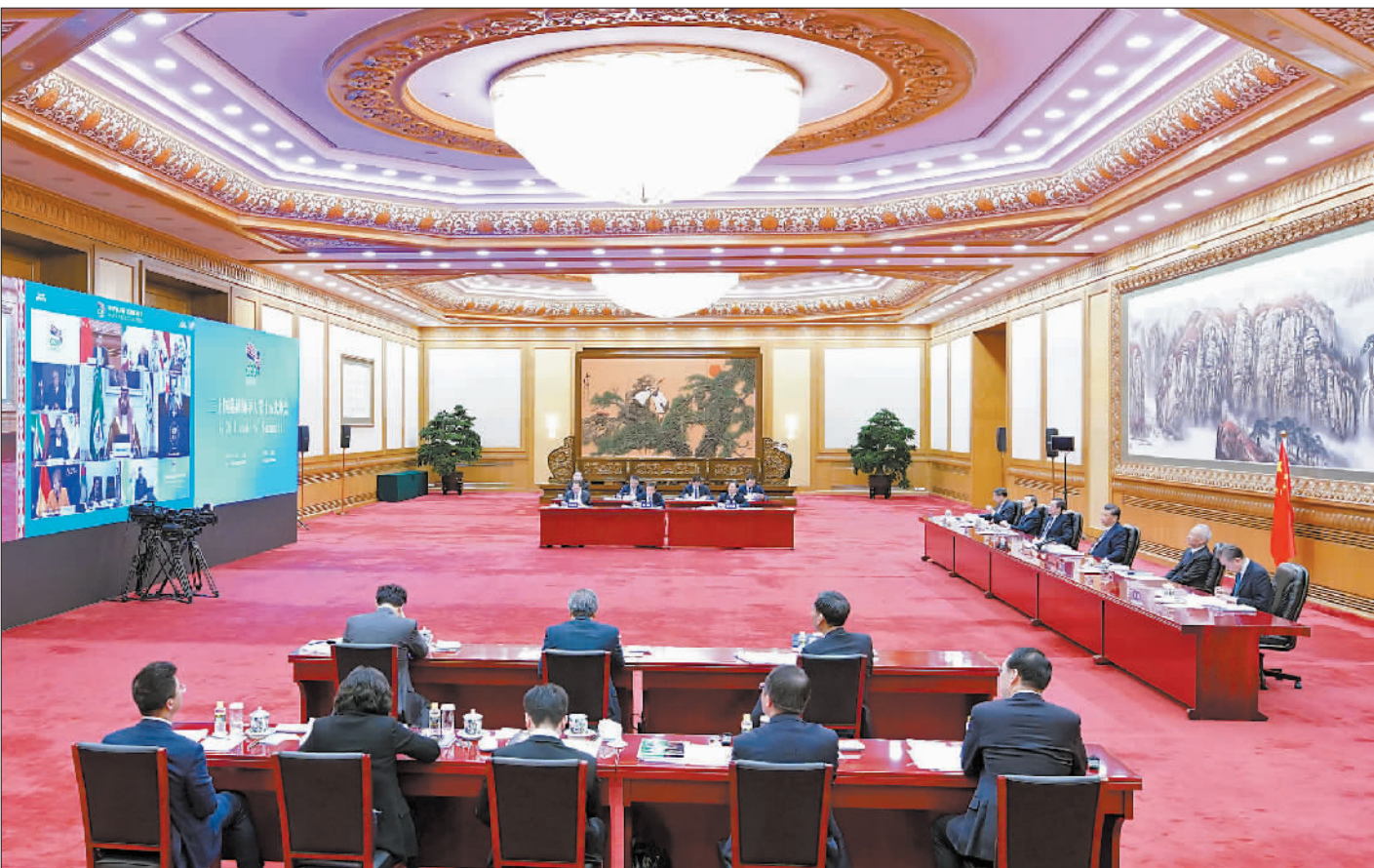
11月21日晚,国家主席习近平在北京以视频方式出席二十国集团领导人第十五次峰会第一阶段会议并发表重要讲话。

■二十国集团应该遵循共商共建共享原则,坚持多边主义,坚持开放包容,坚持互利合作,坚持与时俱进,在后疫情时代国际秩序和全球治理方面发挥更大引领作用