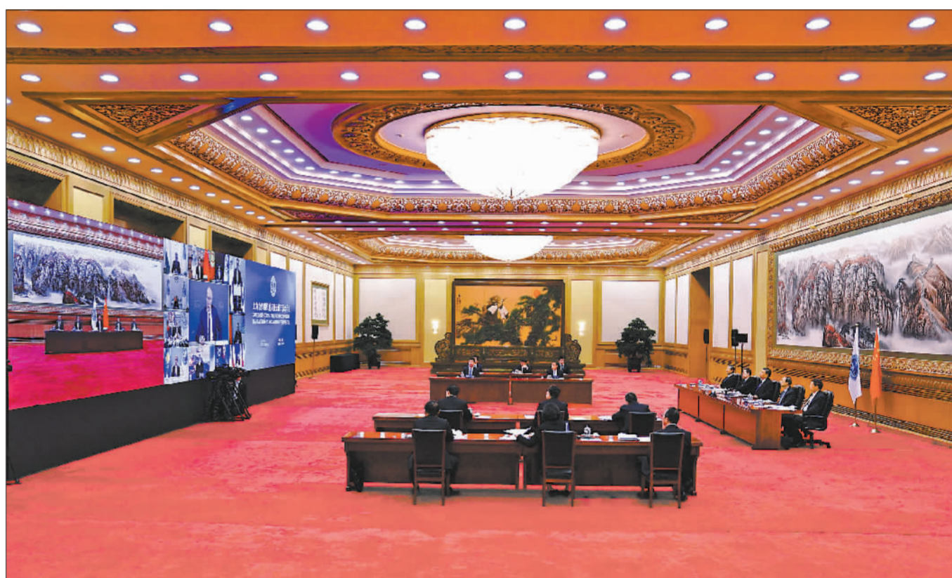
11月10日晚,国家主席习近平在北京以视频方式出席上海合作组织成员国元首理事会第二十次会议并发表重要讲话。

新华社北京11月10日电 国家主席习近平10日晚在北京以视频方式出席上海合作组织成员国元首理事会第二十次会议并发表题为《弘扬“上海精神” 深化团结协作 构建更加紧密的命运共同体》的重要讲话。习近平强调,上海合作组织要弘扬“上海精神”,加强抗疫合作、维护安全稳定、深化务实合作、促进民心相通,携手构建卫生健康共同体、安全共同体、发展共同体、人文共同体,为推动构建人类命运共同体作出更多实践探索。