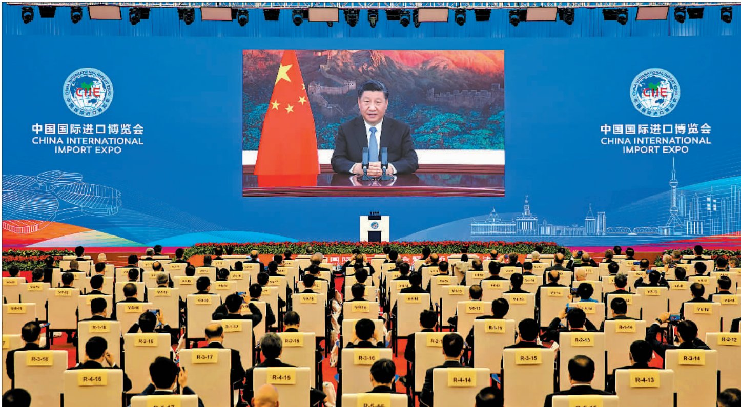
11月4日晚,第三届中国国际进口博览会开幕式在上海举行,国家主席习近平以视频方式发表主旨演讲。