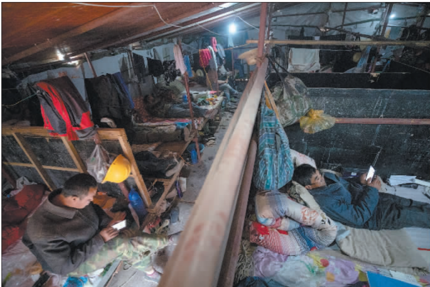
5月17日,工人们在帐篷里午休。为方便生活,帐篷里配备了发电机和手机信号增强器。