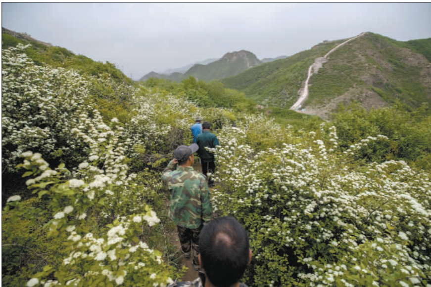
5月17日,正值山花烂漫,工人们在返回宿舍的路途中经过一片花丛。从工作区到宿舍区,工人们有时需要半个多小时才能到达。