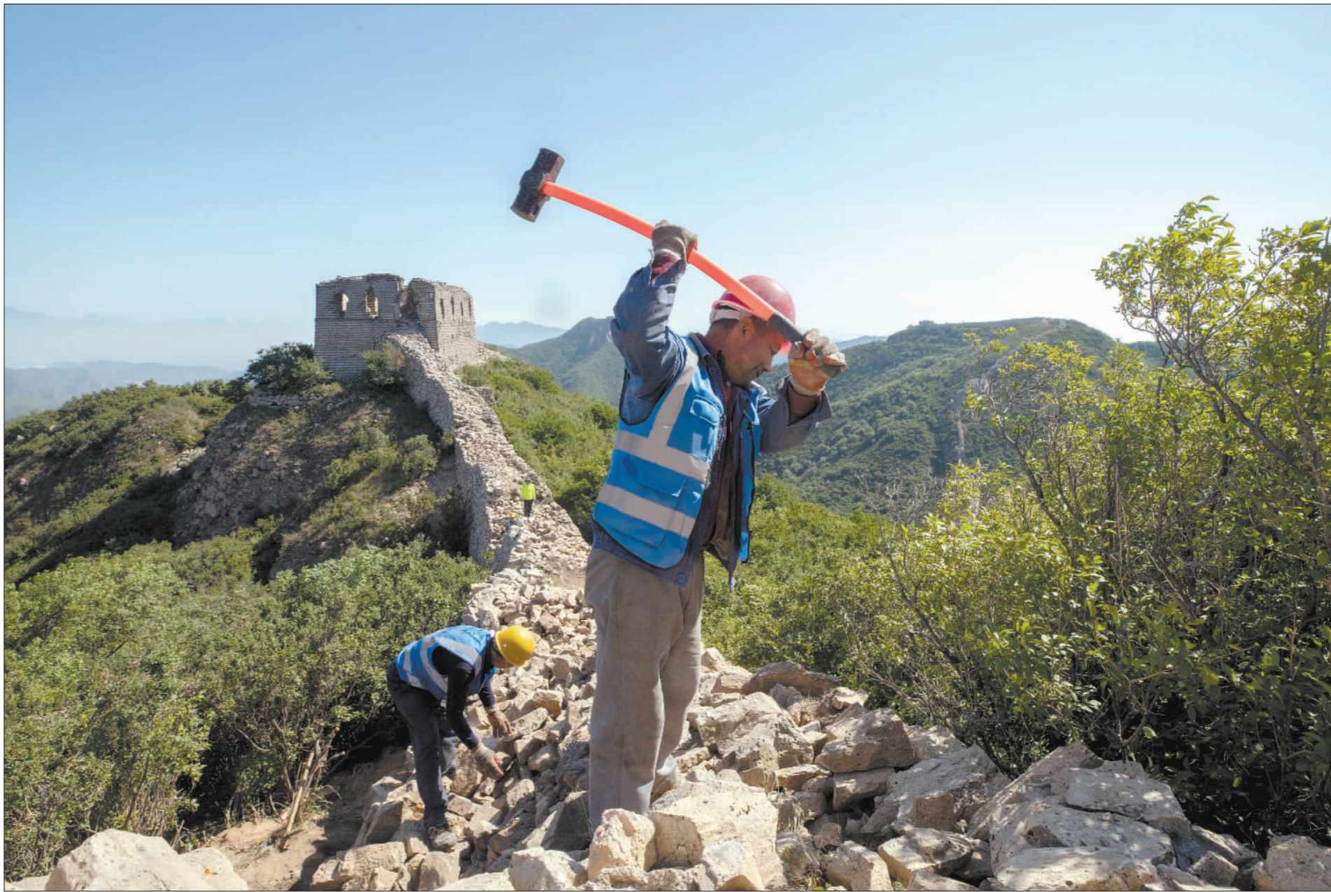
2019年7月3日,北京市昌平区流村镇的明长城上,工人们正在清理坍塌处的碎石。由于该长城的马道和墙体大多已经坍塌,施工队员们必须将碎石和杂物清理干净,重新修筑。

据国家文物局统计,长城遍布我国15个省(区、市)的404个县(市、区),各类遗存总计4.3万余处(座/段)。其中,墙体设施保存比例为1/2以上,墙基、墙体留存比例为3/4以上的,属于保存现状较好的长城点段,仅占总数的12.3%,仍有大量的长城需要修缮。