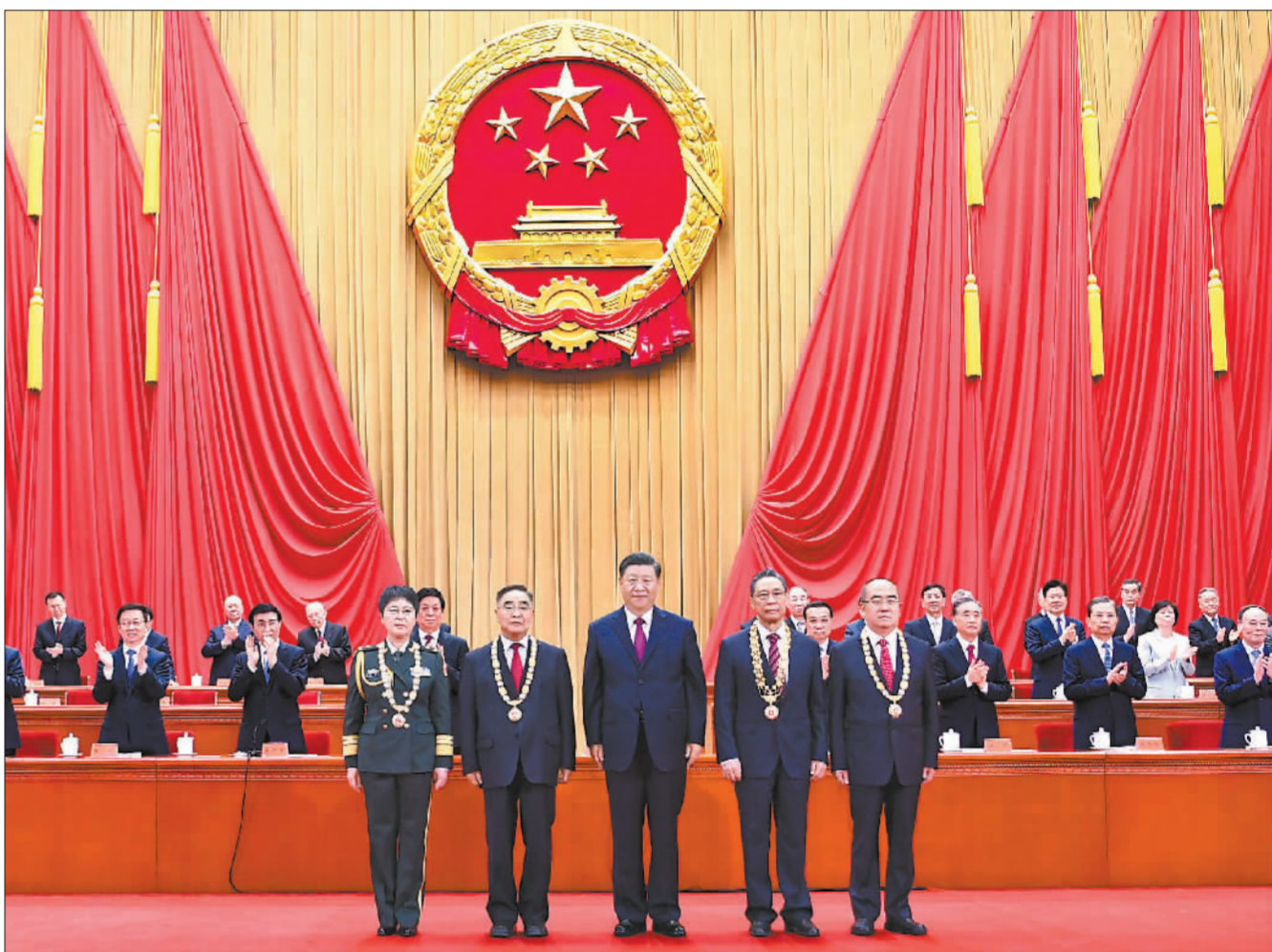
9月8日,全国抗击新冠肺炎疫情表彰大会在北京人民大会堂隆重举行。中共中央总书记、国家主席、中央军委主席习近平向“共和国勋章”获得者钟南山(前排右二)、“人民英雄”国家荣誉称号获得者张伯礼(前排左二)、张定宇(前排右一)、陈薇(前排左一)颁授勋章奖章。