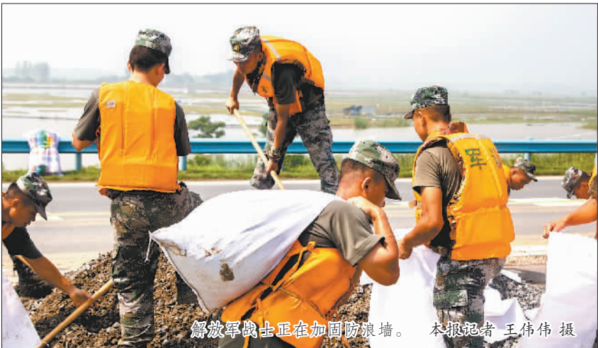
解放军战士正在加固防汛墙。