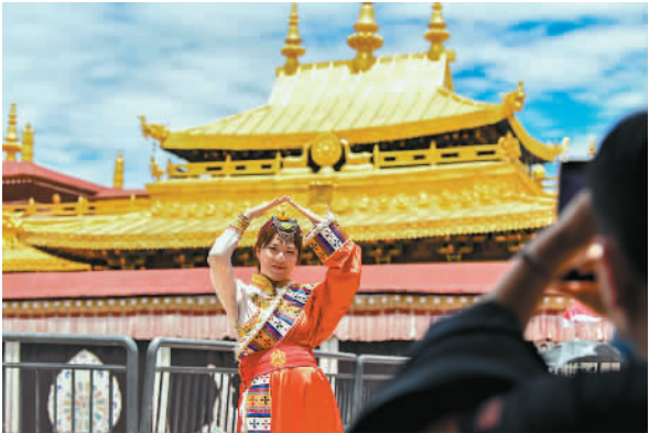
7月2日,游客在大昭寺金顶前留影。当日起,在暂停对外开放五个多月后,西藏大昭寺恢复对外开放。