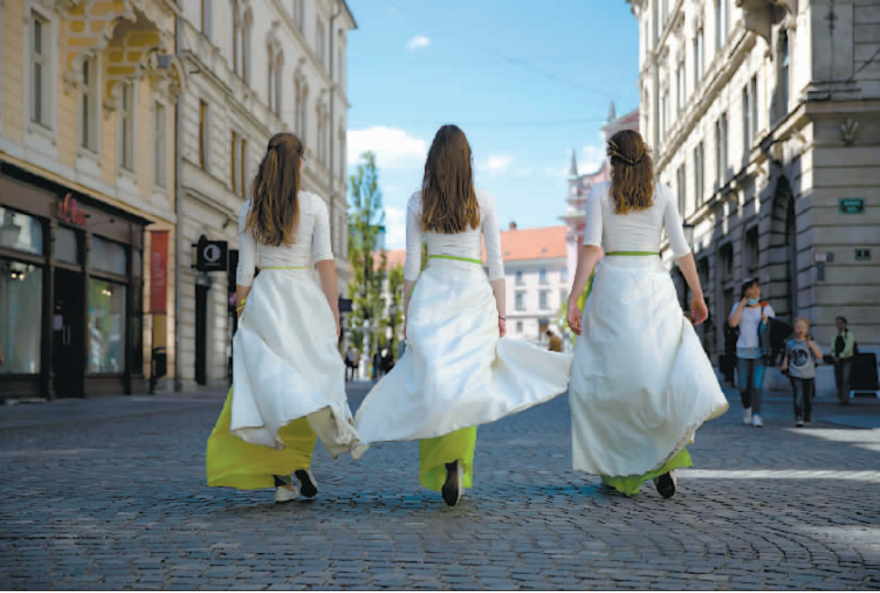
5月27日,在斯洛文尼亚首都卢布尔雅那,三名女孩走在市中心的路上。