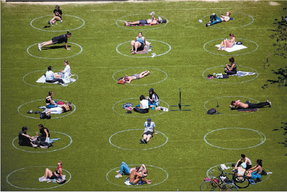
5月27日,在美国纽约,人们在草坪上限制社交距离的圆圈内休闲。