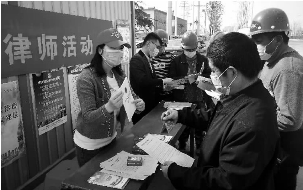
3月24日,安徽合肥的律师志愿者介绍城乡困难群体法律援助内容。