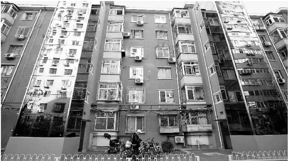
2019年11月14日拍摄的北京一社区加装了电梯的居民楼。