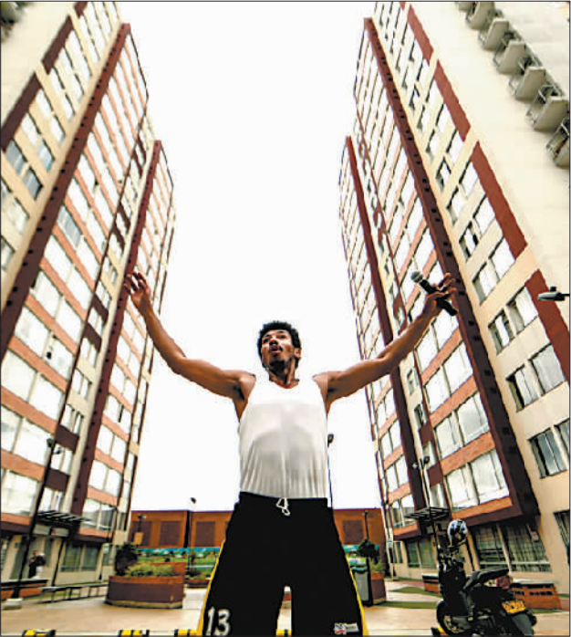
哥伦比亚:在小区里做操

中国与世界各国并肩抗疫,用实际行动诠释人类命运共同体理念。正如世卫组织总干事谭德塞日前所说,未来几天、几周以及几个月将“考验我们的决心,我们对科学的信赖和我们的团结互助精神”,应对疫情的要点是同舟共济。(执笔记者:冯玉婧;参与记者:沈忠浩 刘曲 彭立军 程婷婷 陈霖 袁梦晨 夏鹏 王瑛 徐烨 徐永春) (据新华社北京4月8日电)