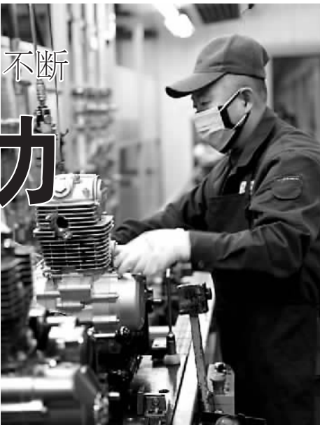
宗申发动机生产线上工人正抓紧生产。

疫情虽然给外贸企业带来冲击,但也倒逼了企业转型升级。在重庆多家外贸企业的负责人看来,疫情带来的挑战有可能给传统外贸