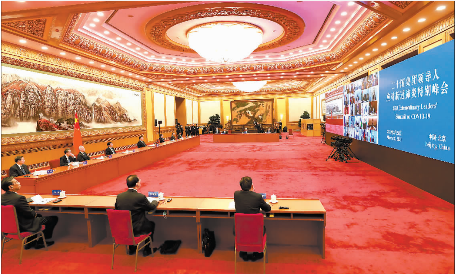
3月26日,国家主席习近平在北京出席二十国集团领导人应对新冠肺炎特别峰会并发表题为《携手抗疫 共克时艰》的重要讲话。