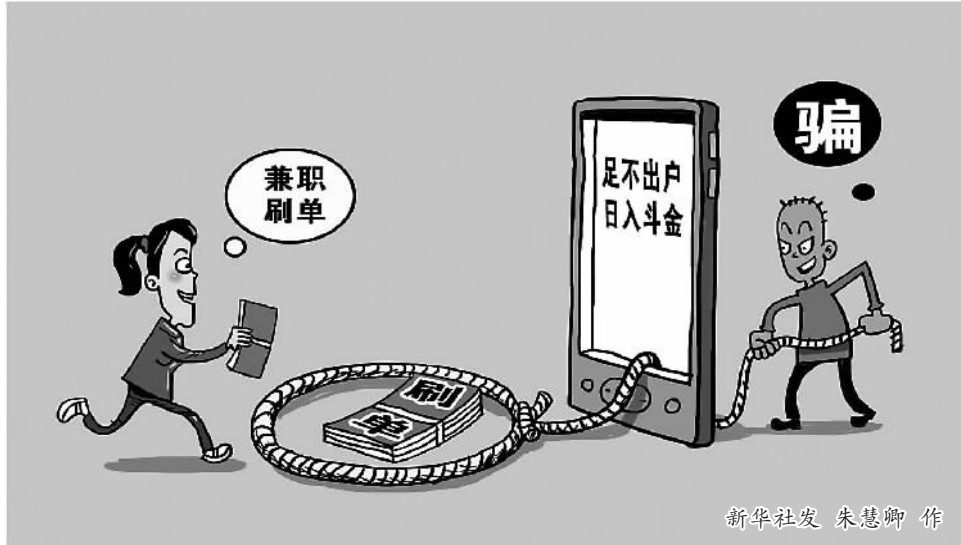
新华社发 朱慧卿 作

2018年年初,马某民、张某虎、狄某、孔某某提出辞职。随后,4人先后向乌鲁木齐经济技术开发区(头屯河区)劳动人事争议仲裁委