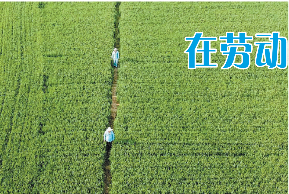
3月15日,泗洪输油站管道班职工在巡检。